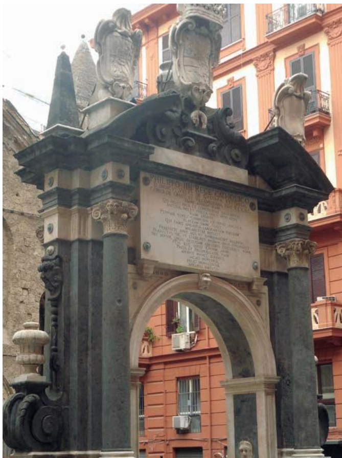
Fontana della Sellaria, Nápoles. 1649. Mandada construir durante el virreinato de Íñigo Vélez de Guevara, VIII conde de Oñate. Véase escudo familiar en la parte superior izquierda