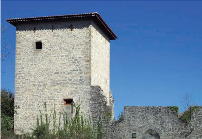
Torre de Guevara. Siglo XVI