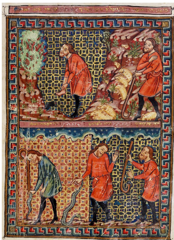
Figura 3 – Êxodo – Manuscrito Haggadah sefardita catalão do século XIV