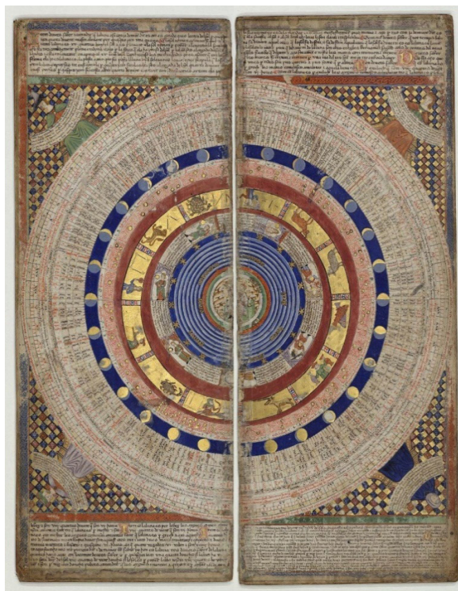
Figura 2 – Macrocosmo