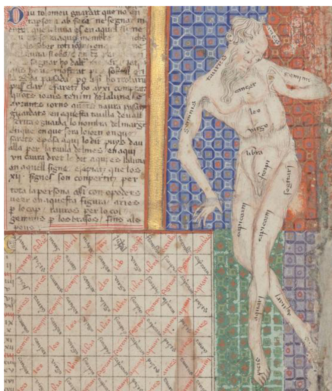
Figura 1 – O homem zodiacal e a tabela de correspondência de signos zodiacais com as partes do corpo Humano