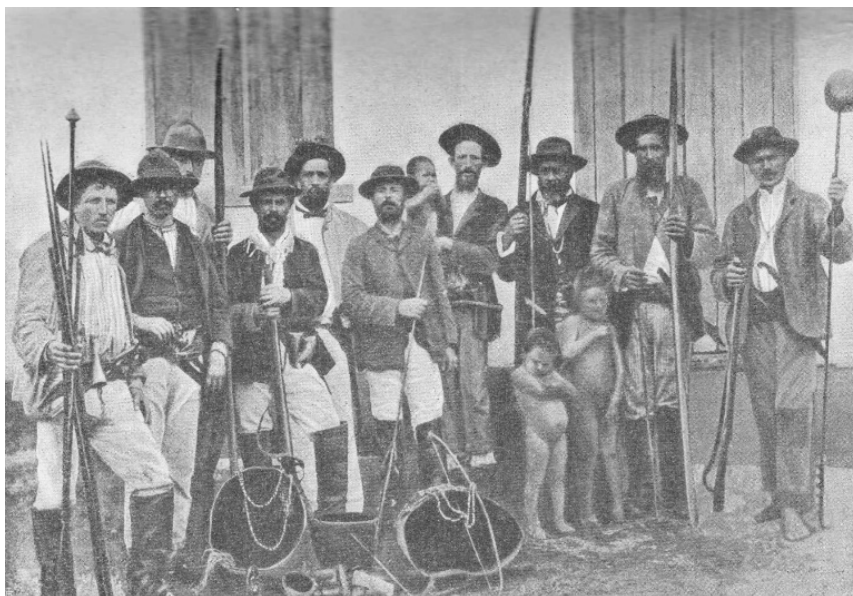
Figura 1 - Fotografia pesquisada por Piero Brunello

Fonte: Fotografia extraída do livro Colonos e Missionários Italianos na Floresta do Brasil , de Padre Luigi Marzano.