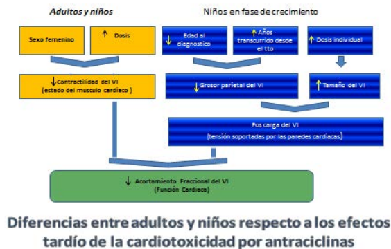
Fig. 1 Diferencias entre adultos y niños respecto a los efectos tardíos de la cardiotoxicidad por antraciclina.

Si quisiéramos hacer un resumen de la tónica diagnóstica más utilizada en el mundo actual, debemos enunciar los siguientes procedimientos: