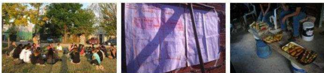
Foto 3. Acciones colectivas registradas durante la primera etapa de El Pueblo Construye

personas son, además, trabajadorxs de la construcción, y pusieron a disposición sus propias herramientas de trabajo. Por su parte, el tiempo destinado a los almuerzos constituyó otra práctica de acción colectiva. Allí, además del intercambio de recetas (muchxs de lxs participantes son originarixs de países limítrofes), se realizaba una lectura para el debate y la formación política de lxs participantes. Las jornadas de trabajo, desarrolladas los días sábados entre las 8 y las 18 horas, representaron también acciones colectivas en tanto constituyeron espacios y momentos de encuentro, intercambio de saberes, y de historias de vida. Ante la falta de recursos económicos, se gestionaron y llevaron adelante actividades como ferias, rifas, festivales, gestión de aportes económicos, que permitieron resolver pequeños faltantes en las obras (Foto 3).