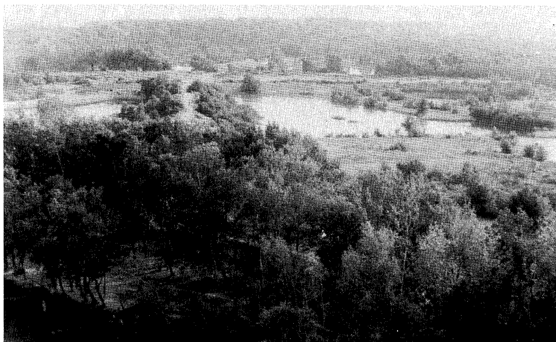
Fotografía n.º 4

Detalle de un área dragada en el cauce del río Gállego. La dirección de la corriente es desde el fondo de la fotografía hacia el observador.