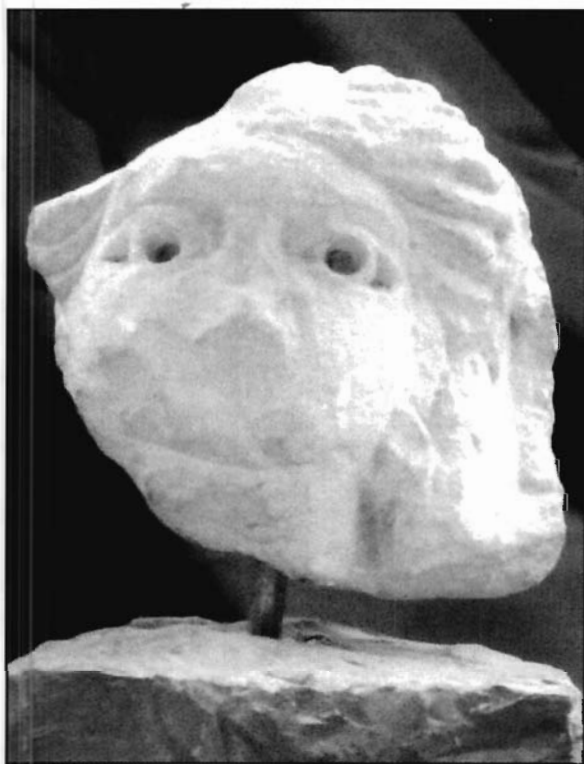
Lámina 3. Fragmento de cabeza, procedente de La Guardia.