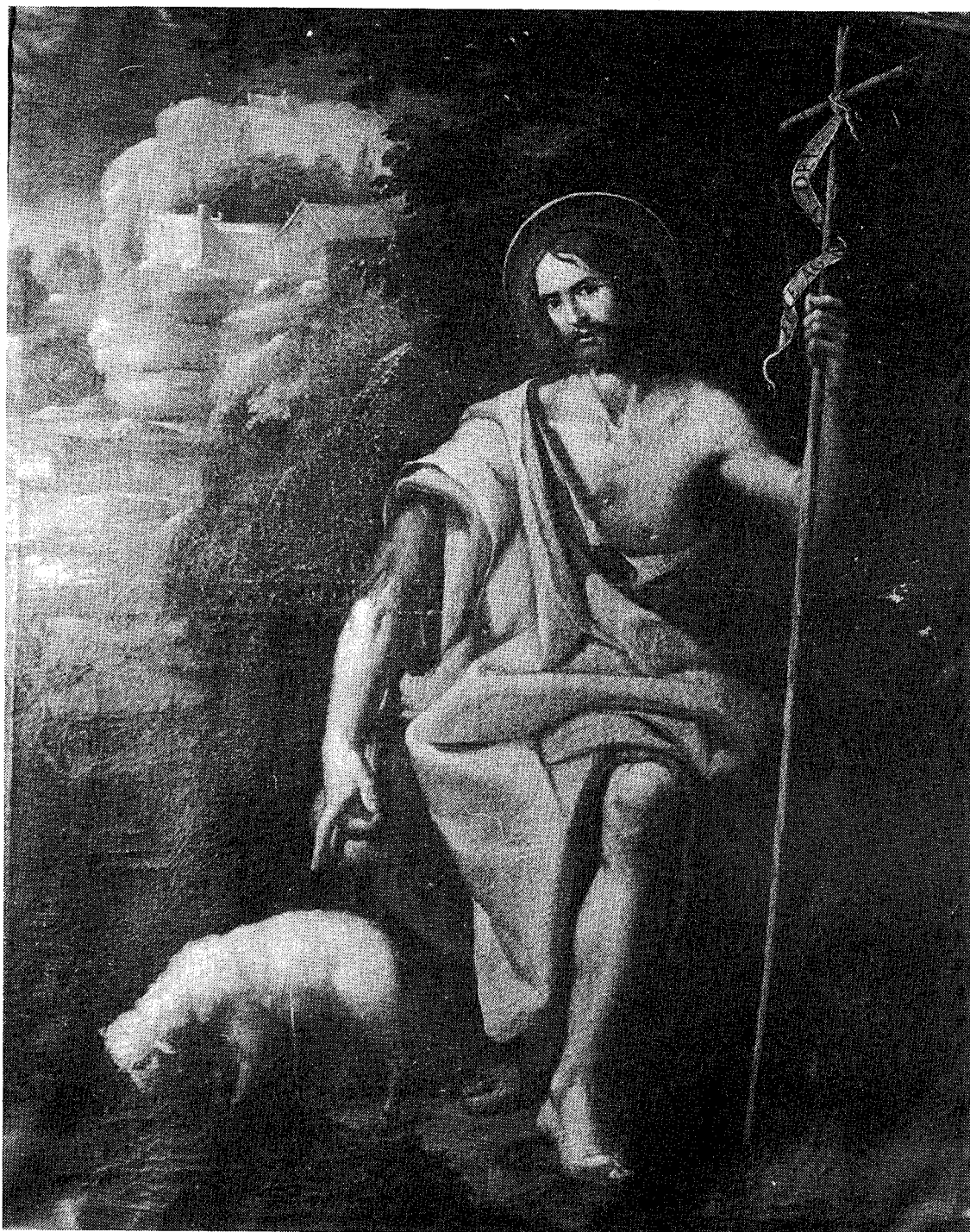
5.- PEDRO RUIZ DE SALAZAR. San Juan Bautista . H. 1657-60.