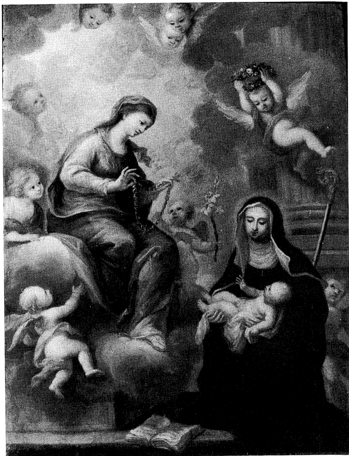
8.- ANONIMO ITALIANO. Santa Gertrudis con la Virgen . S: XVII.