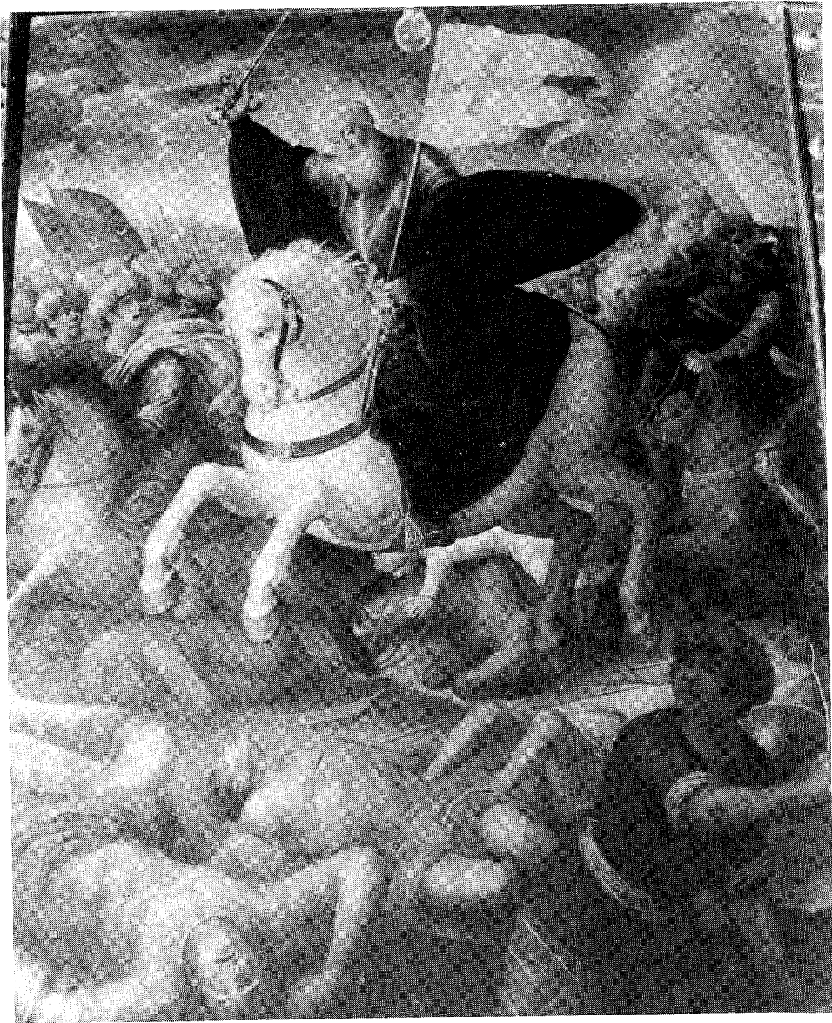
4.- BARTOLOME ROMAN (?). San Millán en la batalla de Hacinas. H. 1635-40.