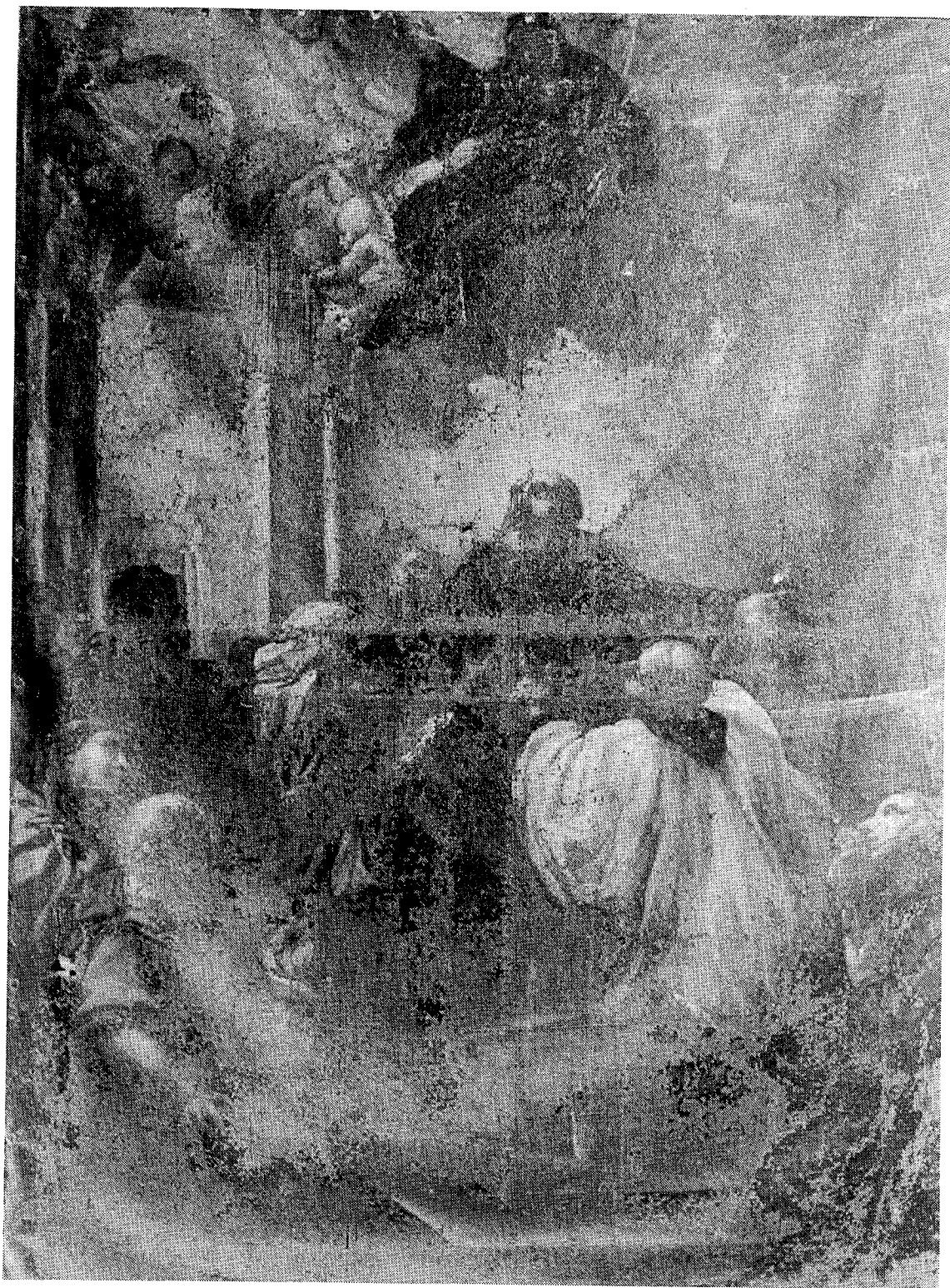
7.- LAZARO BALDI. Visión de San Benito . H. 1700.