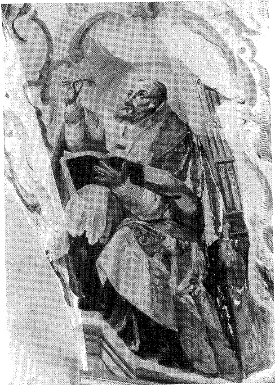
2.- JOSE BEJES. San Anselmo (bóveda de la Sacristía). 1766.