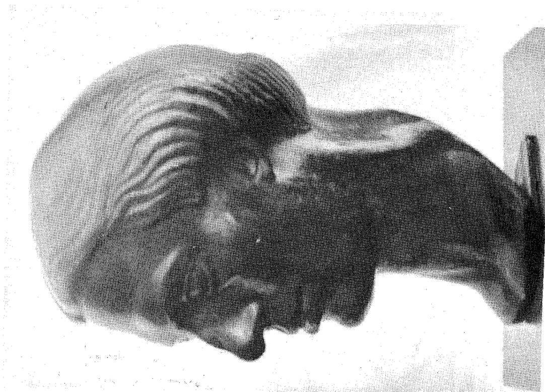
Fig. 2.- Cánepa.