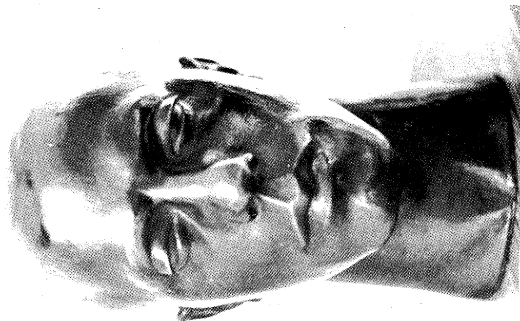
Fig. 1.- Autorretrato.