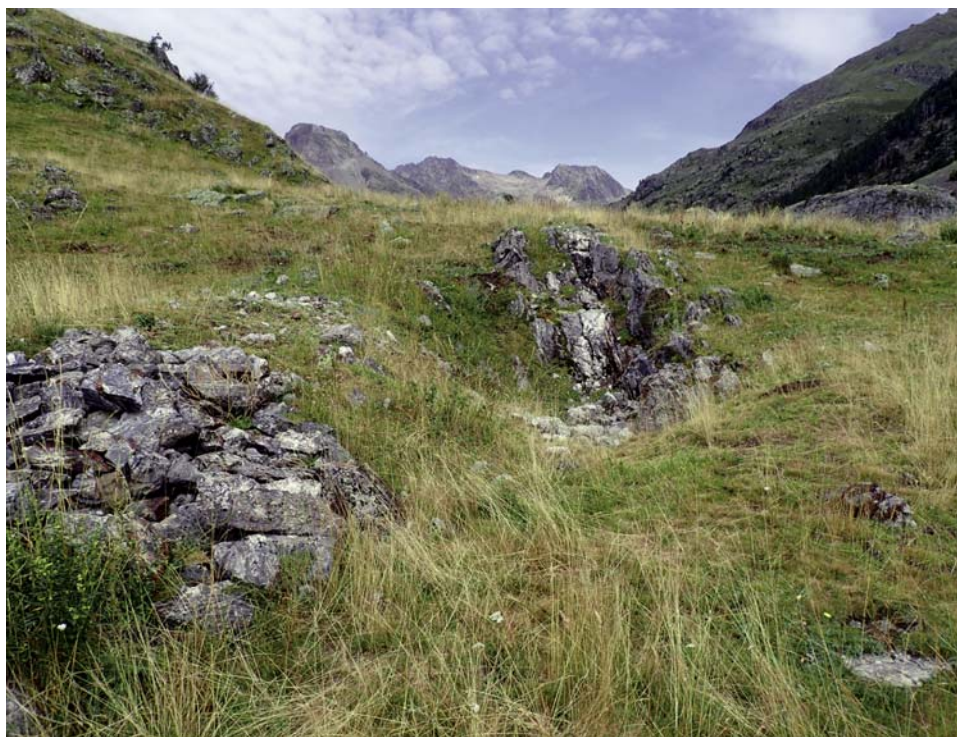
Fig. 2. En el centro, cata Labaza I y sus filones en el valle de Bujaruelo. A la izquierda, pequeña escombrera.

Las labores mineras identificadas en Labaza (Torla) se limitan a 6 unidades, distribuidas en una superficie reducida que se circunscribe al cerrieto señalado. Las denominadas Labaza I y II son dos pequeñas catas junto al camino en la zona sur, reconocibles por pequeñas escombreras y acopios de mineral extraído (figs. 2 a 4). En Labaza II se observan en superficie unos finos filones de color blancuzco con dirección general N 310 y buzamiento 45 E. Como labor, en Labaza III se ha designado una larga zanja en la zona superior del cerro que llega puntualmente a más de 2 metros de profundidad y con una cabida de unos 100 metros cúbicos. Sigue la dirección general de los filones reseñados en Labaza II. Tiene algunas pequeñas zonas de acopio de mineral y escombreras de estériles en la cara norte del cerro. En sus cercanías, hacia el este, se hallan otras