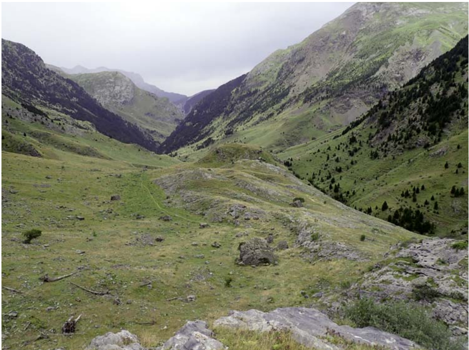
Fig. 1. Cerrito minero de Labaza, en el valle de Bujaruelo, visto desde el norte.

No hay mucha información sobre minería en el valle de Bujaruelo. La primera referencia escrita encontrada es de José Viu y Moreu, natural de Torla, autor de un manuscrito en 1832 que fue publicado recientemente (VIU, 2015), donde señala una mina de oro, plata y plomo en Bujaruelo y menciona otra, no localizada, de oro. MALLADA (1878) no dice nada sobre este valle en su capítulo de datos mineros, aunque cita la presencia de cristalillos de pirita de hierro en calizas del Devónico y del Silúrico del