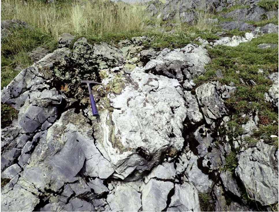
Fig. 3. Filones en Labaza II.

dos pequeñas catas (Labaza IV y V), en la primera de las cuales se ha encontrado una mínima muestra de mineral verde.