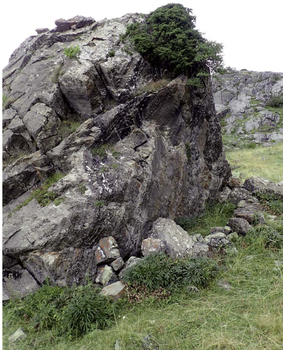
Fig. 6. Restos del abrigo en la cercanía de las minas.