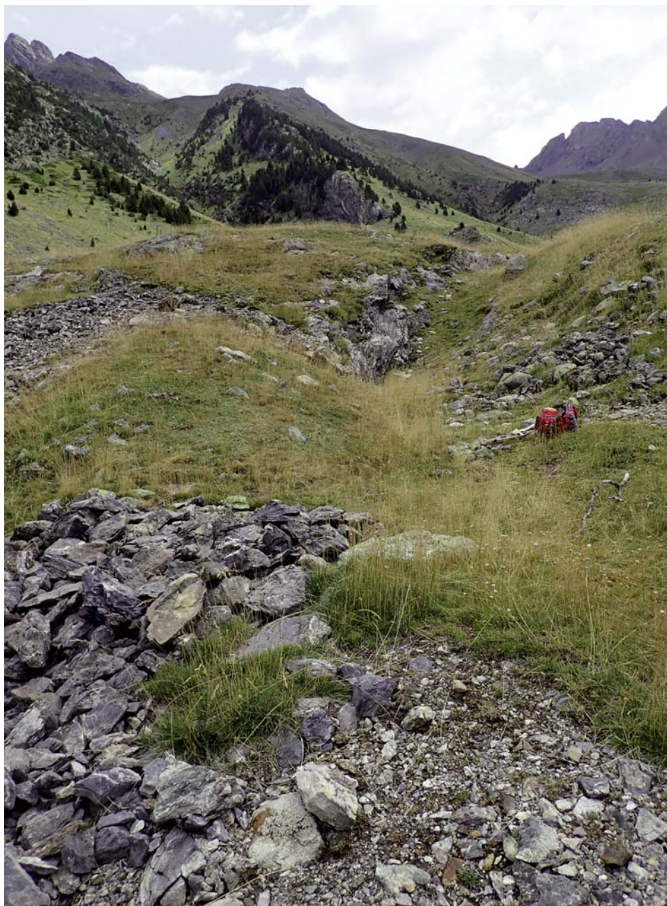
Fig. 4. Calicata longitudinal en el centro, rodeada de zonas de acopio de mineral y escombreras de estéril.