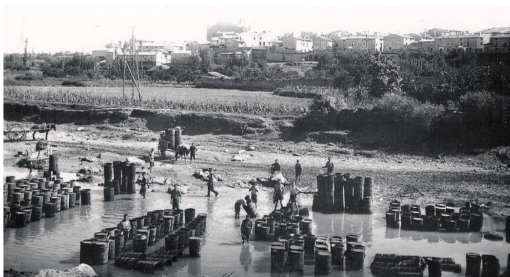
Figura 11. Vista de Cintruénigo, 1948. Al fondo, la calle Espeñas y, sobre ella, la villa.

De ahí que, en 1630 43 , a la hora de representar la villa de Cintruénigo de forma esquemática (fig. 12), esta fuera pintada sobre las peñas en las que se encontraba el Arrabal y el contiguo barrio de la Puerta de Fitero, con el que continuó la expansión