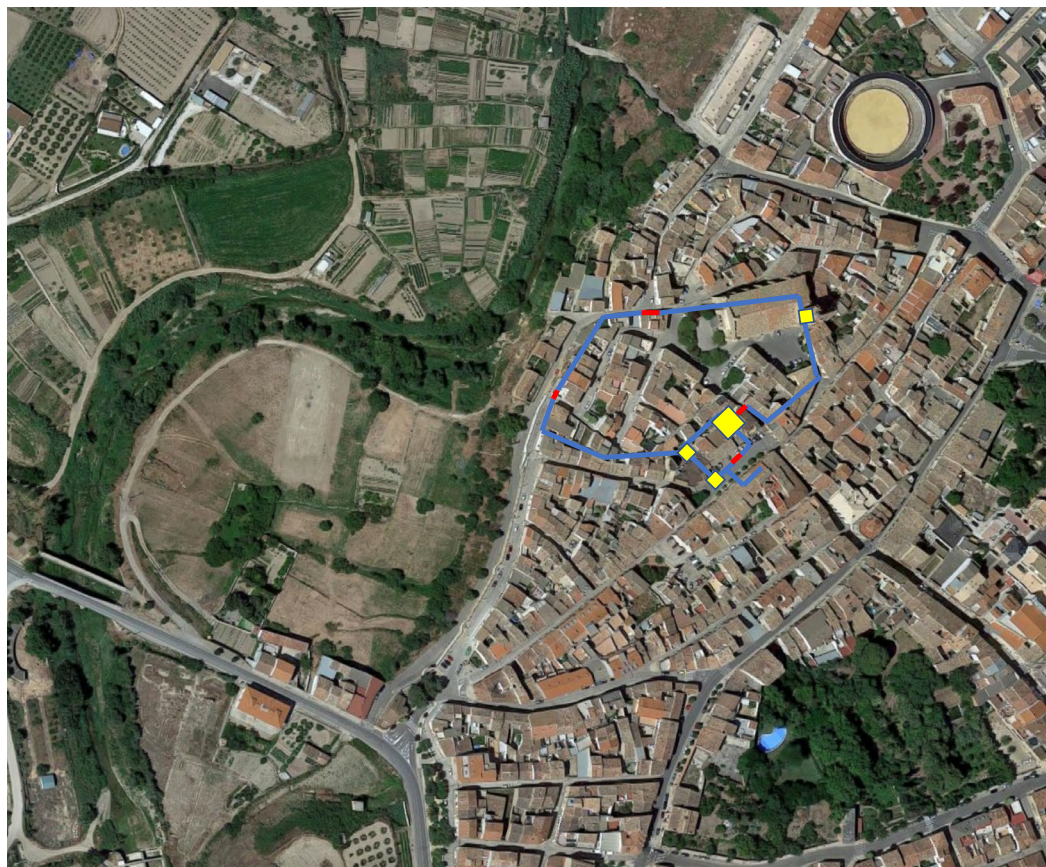
Figura 1. Hipotético trazado del recinto amurallado medieval de la villa de Cintruénigo, «adosado en su lado su- doeste al castillo y en el lado oriental a la iglesia», esto es, en dirección hacia Tudela 3 .