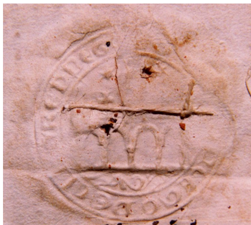
Figura 3. Sello utilizado por el Concejo de Cintruénigo, en 1549 19 .

no se cita explícitamente que su elemento principal sea un puente, no ha lugar a dudas, sentándose así el error que se ha perpetuado hasta nuestros días.