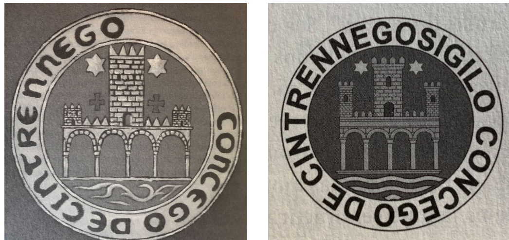
Figura 6. Propuesta de recreación, realizada por Remírez (2016, pp. 449, 458, 463).

Alrededor de todo el conjunto descrito, ambos sellos llevan la siguiente leyenda circular, enmarcada dentro de una orla perimetral, formada por una línea interna y otra externa: [sigilo] concego de Cintrennego. A pesar de que ninguna de estas leyendas está completa, como consecuencia de la pérdida de la cera y del desgaste del papel en el que quedaron adheridos ambos sellos, es indudable que la primera palabra que debería preceder al «Concejo de Cintruénigo» debería corresponder a sello [sigillo], seguramente grabada de forma completa como se deduce por el amplio espacio que queda en la leyenda circular 33 .