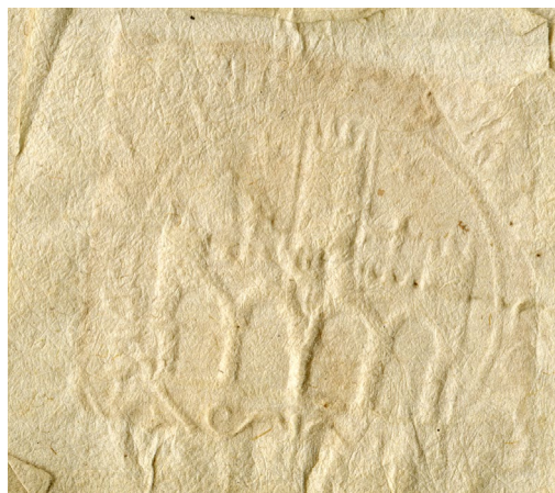
Figura 2. Sello utilizado por el Concejo de Cintruénigo, fechado en 1635 (entre el 23 y el 30 de agosto).