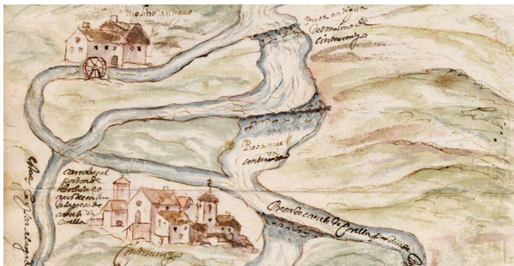
Figura 13. Vista de la villa de Cintruénigo, en 1630, sin la torre mayor, pero con las dos menores.

tica, las torres no se aprecian al estar entremezcladas con las casas que hay en segundo plano. No obstante, la forma de representar las que están en primera línea, en la vista esquemática, parecen estarlo bajo una arquería de porches, que nos permite identificar a estos con los arcos que aparecen en los sellos del Concejo de Cintruénigo, en los que quedaría, en segundo plano, o sea, tras las casas del Arrabal, la muralla de la villa, así como las tres torres que debían de sobresalir por encima de esta, tal y como se verían para alguien que las observara, a mediados del siglo XVI, desde el puente de Cintruénigo. Lo que también nos permite identificar las supuestas ondas del sello carbonero, con las peñas sobre las que se construyó la villa de Cintruénigo, tal y como también se ve en la representación esquemática de 1630.