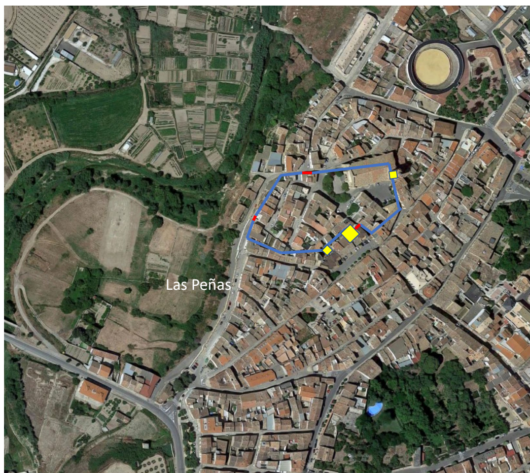
Figura 9. Hipotético trazado del recinto amurallado medieval de la villa de Cintruénigo, sobre las Peñas.

Una descripción en la que queremos destacar el dato de que la villa de Cintruénigo estaba asentada sobre una pequeña elevación, las citadas peñas (fig. 9), sobre las que luego volveremos.