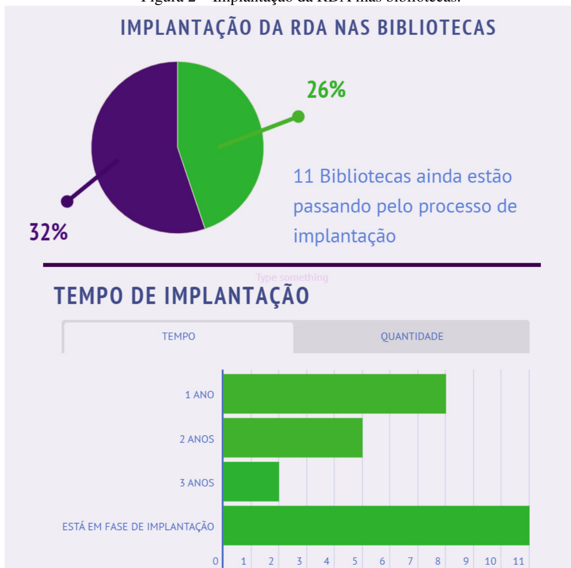
Figura 2 – Implantação da RDA nas bibliotecas.