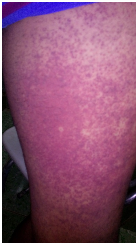
Figura 1. Fotografía del muslo izquierdo del paciente donde se evidencia la intensa vasculitis por dengue.

La fiebre cedió dos días después del ingreso y la erupción cutánea, que se había hecho petequial, luego de desaparecer la fiebre, se hizo equimótica ( Figura 1 ). El paciente mantuvo tos seca persistente a los cambios de posición y, al cuarto día de hospitalización, presentó lipotimia y bradicardia extrema (38 lpm), por lo que fue trasladado a la unidad de cuidados intensivos; donde se le administró oxígeno por catéter nasal y fue tratado con dobutamina, pero no fue preciso mantener este fármaco por tener