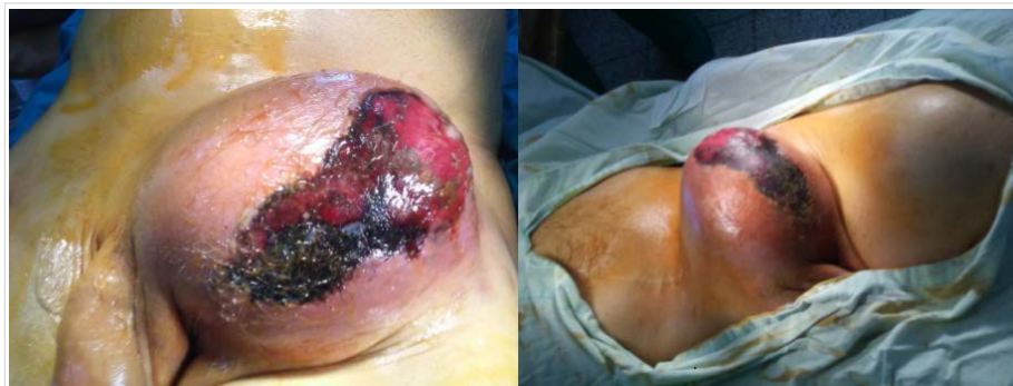
Figura 1. Vistas de la tumoración en región inguinal izquierda, en relación con el pseudoaneurisma.

La aparición de un pseudoaneurisma es considerada una complicación tardía de la cirugía protésica aor-