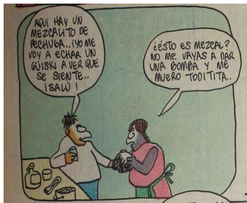
Imagen 4: Lindero tomando junto a Ustolia. Los Agachados , N° 15, 23 de mayo de 1969.

lo retrata arrugados y rotos, como si se tratara del único conjunto que posee. Además, Jeremías se encuentra descalzo y es de tez marcadamente oscura, si se lo compara con los otros personajes (Imagen 3). Estos detalles gráficos resaltan por contraste con aquellos de clase media-alta, o incluso con el propio Fotógrafo de bodas, a quien Rius dibuja con un traje verde oscuro y con el pelo engominado.