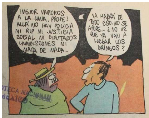
Imagen 2: Don Céfiro y el Profe. Los Agachados, Nº 15, 23 de mayo de 1969.

sátira, en donde se ahonda en la temática principal.