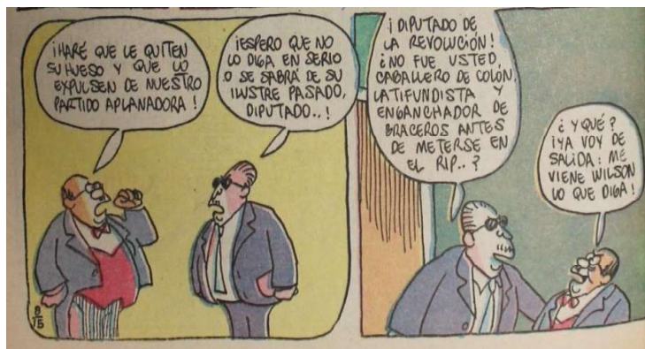
Imagen 5: El Diputado discutiendo con Trastupijes . Los Agachados , Nº 15, 23 de mayo de 1969.

en los emblemas de los personajes rurales, así como en el coloquialismo de sus expresiones verbales). Es en este marco de desigualdades en donde se ubica, a nivel temático, la crítica a la razón instrumental.