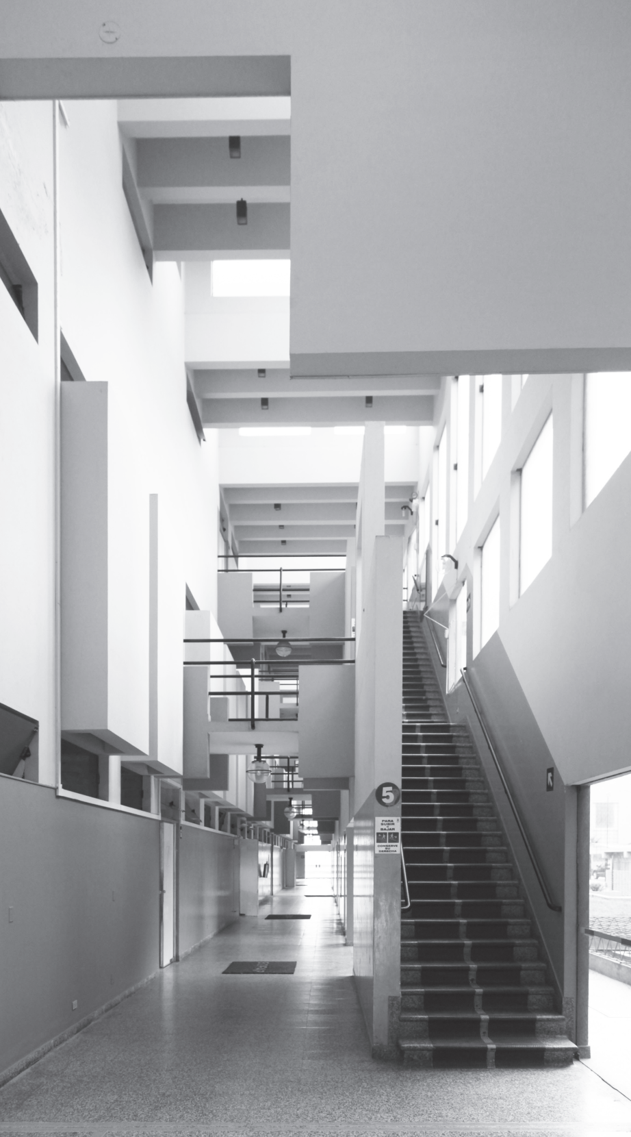
Fotografía 7 Escuela de Oficiales de la Fuerza Aérea del Perú. Interior de la residencia

canónicas del movimiento moderno (en su longitudinalidad y estereotomía) con elementos extraídos de la cultura peruana de construcción de pequeñas luces y columnas de sección cuadrangular de dimensión casi mínima. Probablemente haya una vuelta al localismo, que en casos como el de Stirling alimentaban la ironía de la construcción vernácula en los grandes edificios.