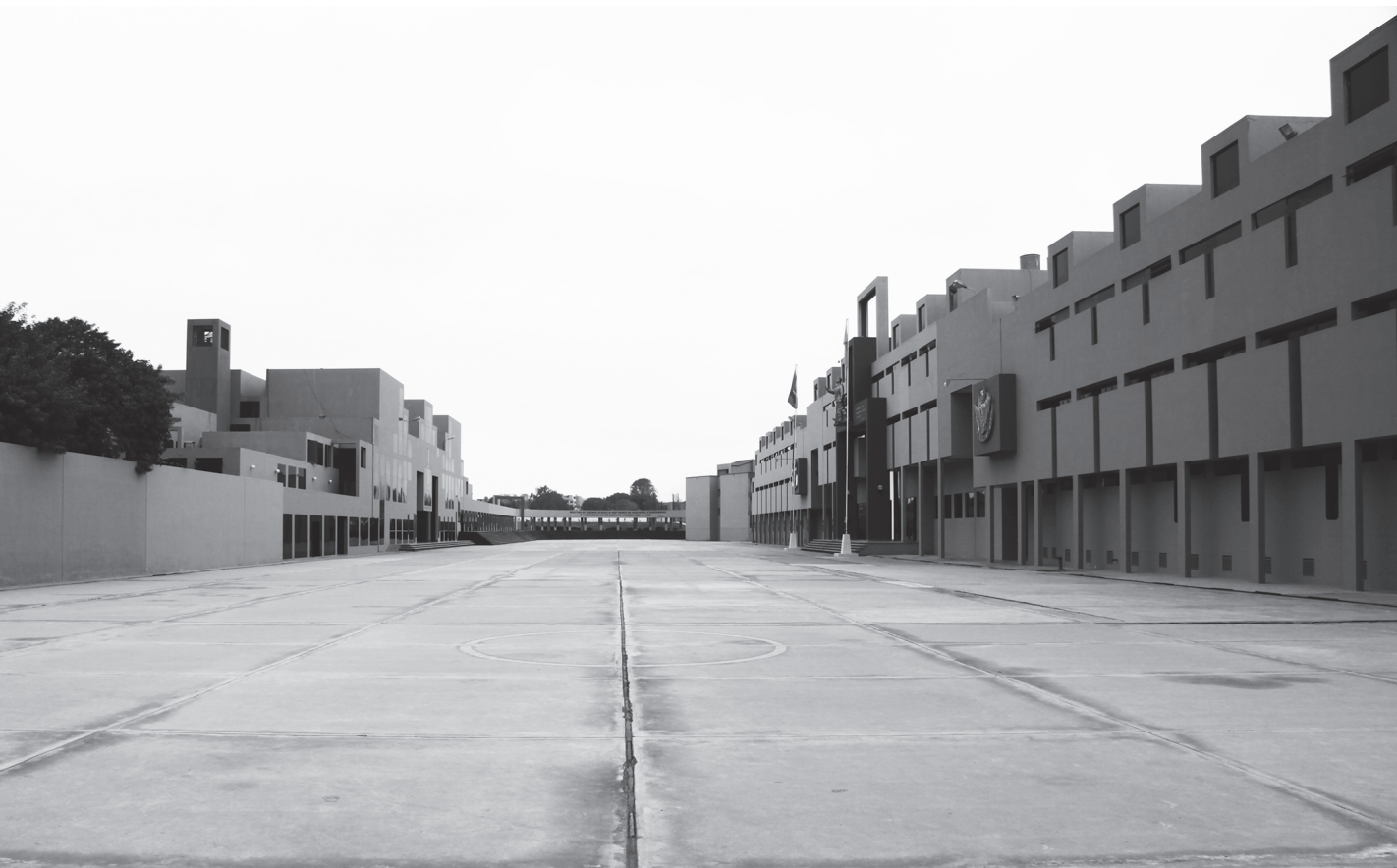
Fotografía 1 Escuela de Oficiales de la Fuerza Aérea del Perú. Patio de ingreso.

6. La kancha constituye la unidad compositiva básica de la arquitectura incaica. Consiste en un vacío de proporciones regulares contenido por un muro perimetral y rodeado de espacios, sean abiertos o cerrados, de proporciones regulares. Las kanchas van a representar espacios públicos contenidos dentro de los recintos, entendidos como espacios sagrados donde el inca o el curaca se comunicaba con la población.