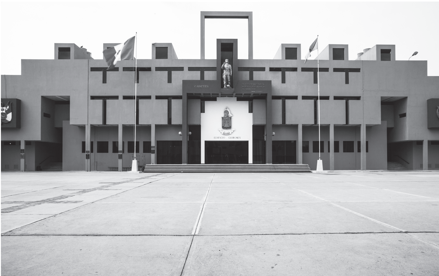
Fotografías 5 y 6 Escuela de Oficiales de la Fuerza Aérea del Perú. Fachada del edificio de comedor y Fachada del edificio de residencia.