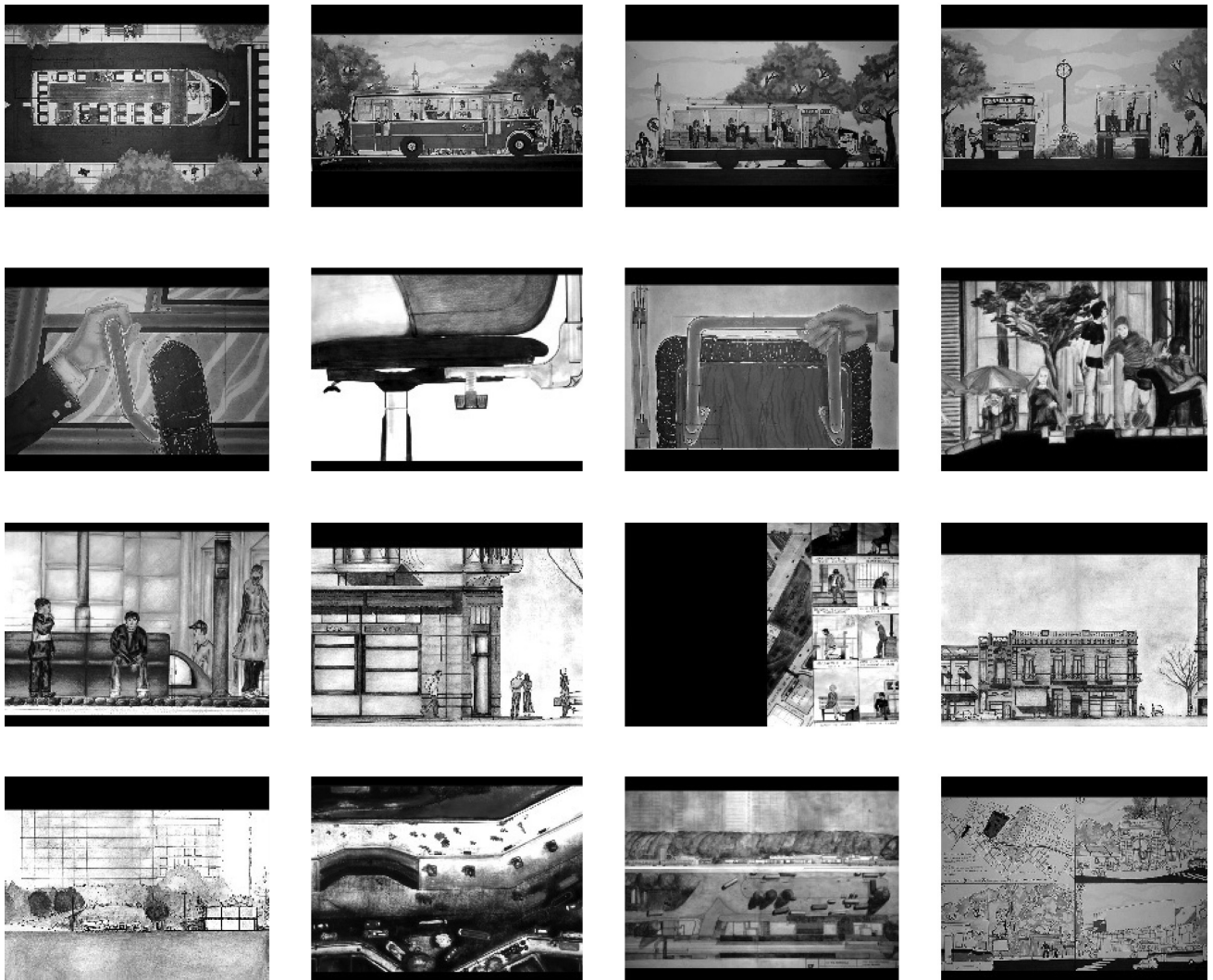
Figura 3 Trabajos sobre los conceptos "dimensión" y "escala" en los primeros años de la cátedra [1986-1998], realizados por distintos estudiantes.

Así, el devenir de las experiencias de los estudiantes, sumado a las facilidades de acceder a nuevas tecnologías, como cámaras digitales, programas de imágenes, etc., permitió abrir nuevas posibilidades de reflexión sobre los conceptos "dimensión", "escala" y "contexto", permitiendo reflexionar sobre el contexto, no solo como el entorno geográfico, físico, cuantificable, medible, sino también como las relaciones que se originan entre procesos culturales, históricos, sociales, económicos y simbólicos.