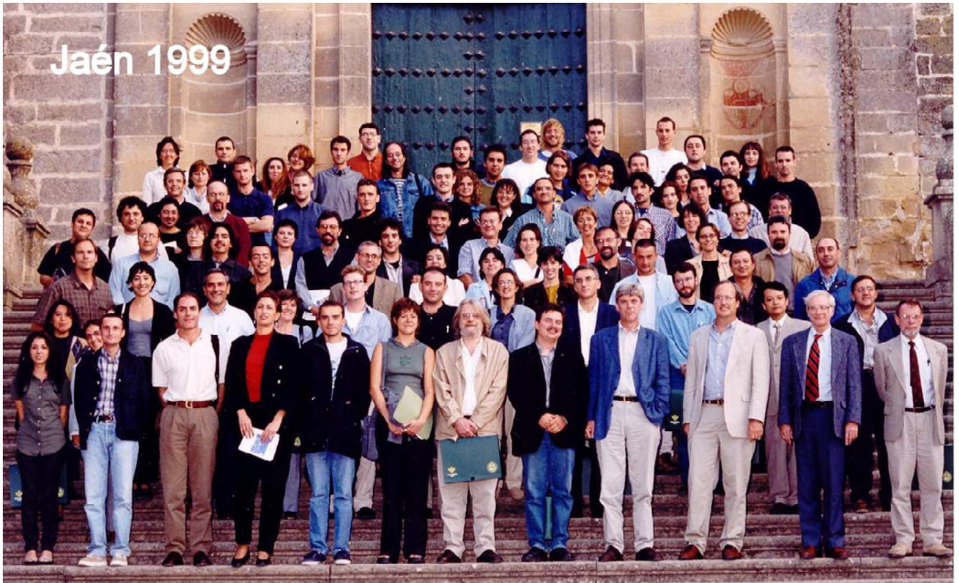
1999 Jaén. SEPC