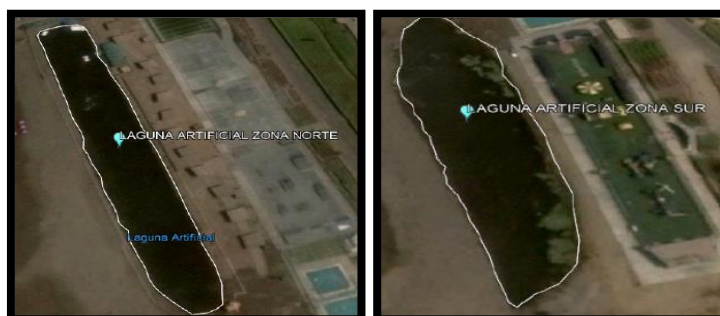
Tabla 1. Parámetros georreferenciales de Zona Norte y Sur de la Laguna de Chorillos-Huacho.