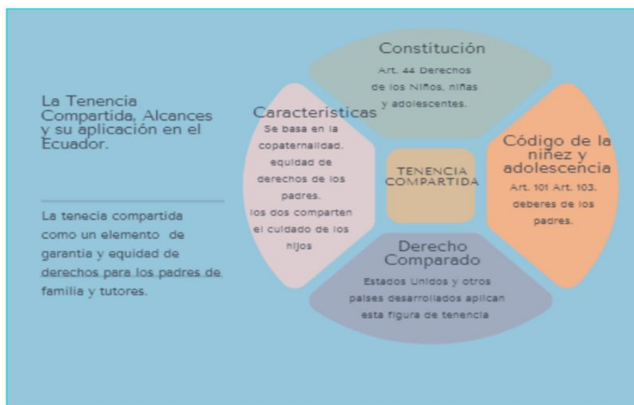
Ilustración 2. Tenencia compartida caracterización en el Ecuador

De acuerdo con Murillo y Vázquez (2020), la constitución se acopla a un Estado de derecho pero sus leyes no se acoplan del todo, debido a que se basa en roles de género autoimpuestos como la madre cría y el padre provee; vulnerando derecho a la familia al usar la tenencia unilateral desde el momento en que se creó dicha figura sin considerar la realidad social del caso; por ende, una mejor solución es aplicar la responsabilidad mutua en caso de no llegar a un acuerdo entre padre e imponer tanto horarios de visita flexibles como pensión económica para garantizar la convivencia en familia y respetar el derecho del padre a estar con su prole sin confundir custodia con tenencia.