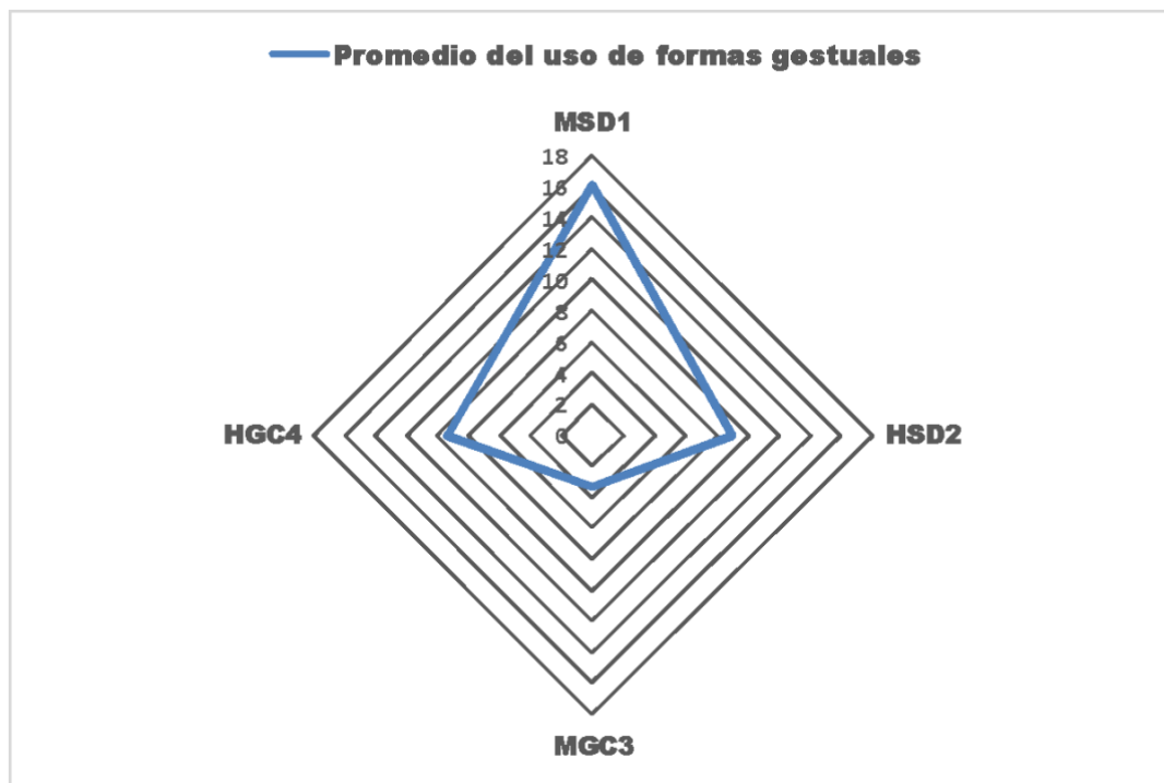
Gráfico 3: Correspondencia en el uso de formas gestuales con la producción verbal

Se sugiere que la diferencia observada entre la selección de una forma gestual u otra ocurre por la naturaleza de la explicación. Determinamos que aquellas secuencias explicativas que daban cuenta de algún procedimiento (hallacas, ponche crema, pizza) estaban acompañadas por un mayor número de formas gestuales, especialmente gestos pantomímicos. Mientras que las explicaciones que se limitaban a describir algún evento ofrecían una menor cantidad de unidades de información que se acompañaban sobre todo de gestos rítmicos.