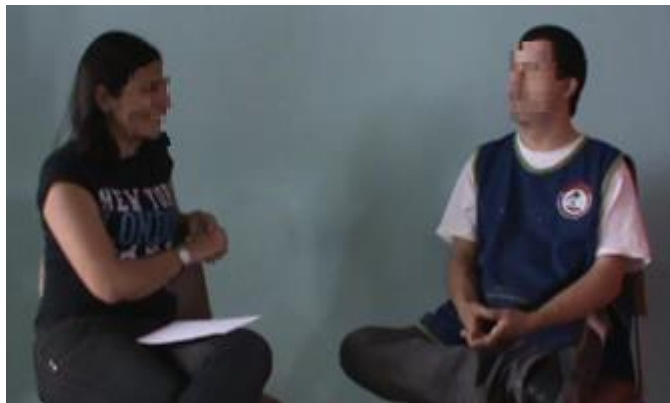
Figura 1. Ubicación de la investigadora y participantes durante el evento comunicativo

Para obtener dichas grabaciones se realizaron cuatro entrevistas semielicitadas (una con cada informante), y en ellas la observadora-investigadora preguntaba o solicitaba información sobre temas de la cotidianidad: deportes, navidad, música, pasatiempos, entre otros. Estas preguntas estaban orientadas a que los hablantes explicaran procedimientos o eventos y así contrastar la producción verbal de una finalidad comunicativa, la explicación, con la producción gestual.