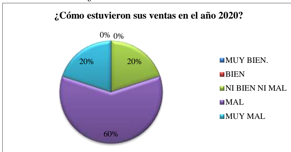
Gráfico 1: ¿Cómo estuvieron sus ventas en el año 2020?

Análisis: El gráfico mostrado anteriormente resalta los siguientes resultados: El 60% (3 personas) respondieron que las ventas estuvieron malas, en cambio un 20% (1 persona) dijo que muy mal y el otro 20% (1 persona) respondió que ni bien ni mal.