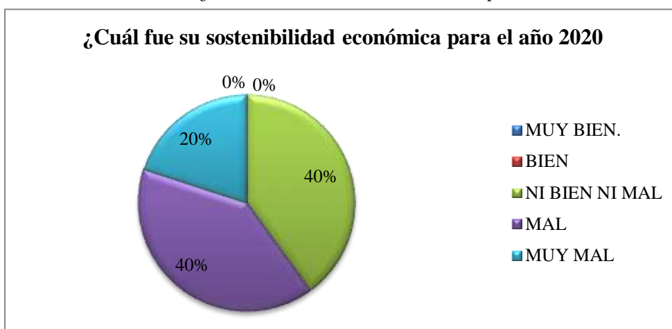
Gráfico 2: ¿Cuál fue su sostenibilidad económica para el año 2020?

Análisis: 40% (2 personas) respondieron que la sostenibilidad económica fue mala en cambio el otro 40% (2 personas) dijeron que ni bien ni mal y el 20% (1 persona) respondió que muy mal.