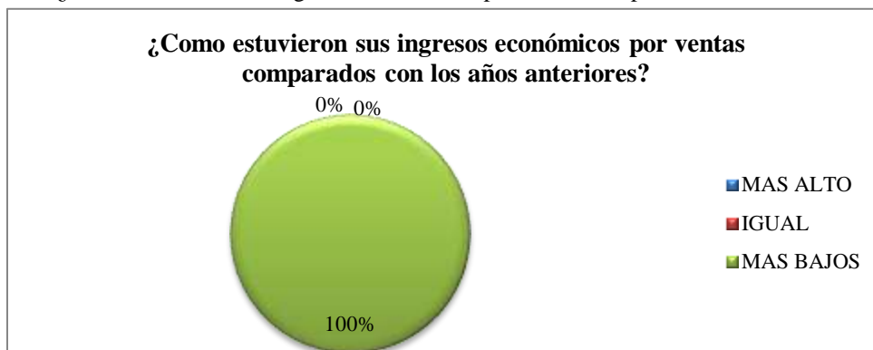
Gráfico 5: ¿Cómo estuvieron sus ingresos económicos por ventas comparados con los años anteriores?

Análisis: El gráfico resalta que el 40% (2 personas) respondieron que los productos que más se venden en la ferretería son los de mantenimiento, en cambio un 20% (1 persona) respondió el de construcción, un 20% (1 persona) el de cerrajería y otro 20% (1 persona) respondió que otros productos.