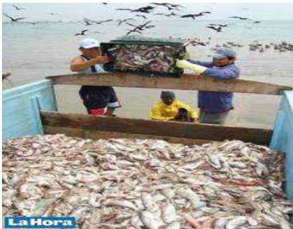
Figura IV: Transporte de la pinchagua