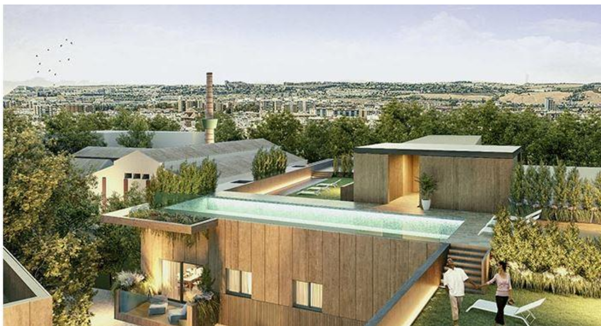
Imagen idealizada de lo que sería la Fábrica de Vidrios La Trinidad urbanizada

En esta segunda zona, la residencial, comprendida por las barriadas de Retiro Obrero , Manuel Carretero , Marqués de Novoa , Calle Beethoven , Barriada de Pío XII y Barriada de Santa María de Ordás , vemos como esa aglomeración paulatina de hogares, desde 1928 hasta 1970 fue creando un tejido comercial que se ha adaptado hasta cubrir las necesidades demandada de abastecimiento y ocio de sus miles de habitantes.