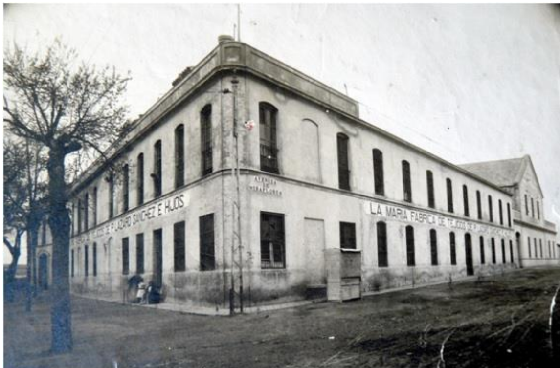
Fábrica de Tejidos La María