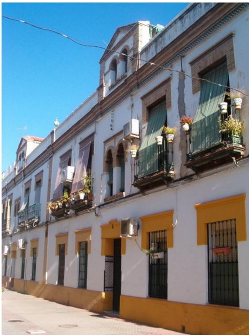
Calle Manuel Carretero