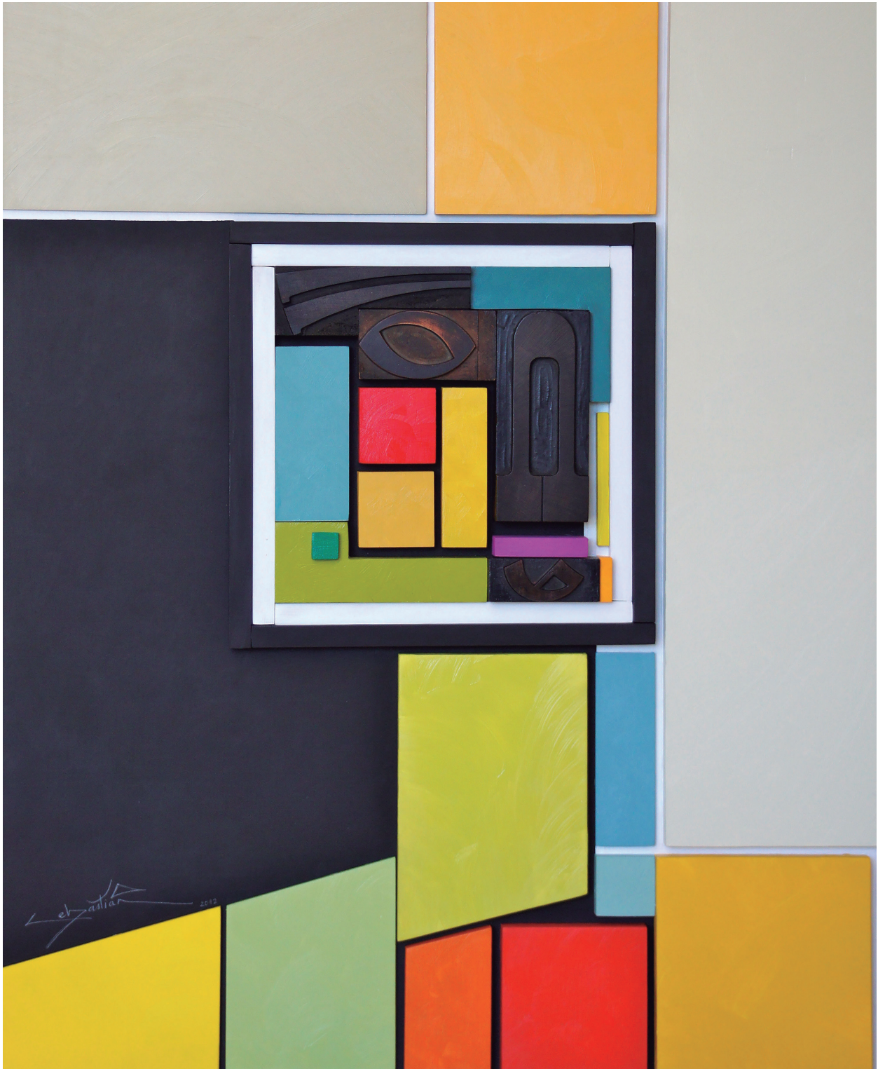
Figura 3. S. García Garrido. A Picasso en el Centenario del Cubismo (2012). Óleo, tipos móviles de madera originales, y bloques de madera sobre tabla. 55,5x68,5 cm. Fuente: propia.