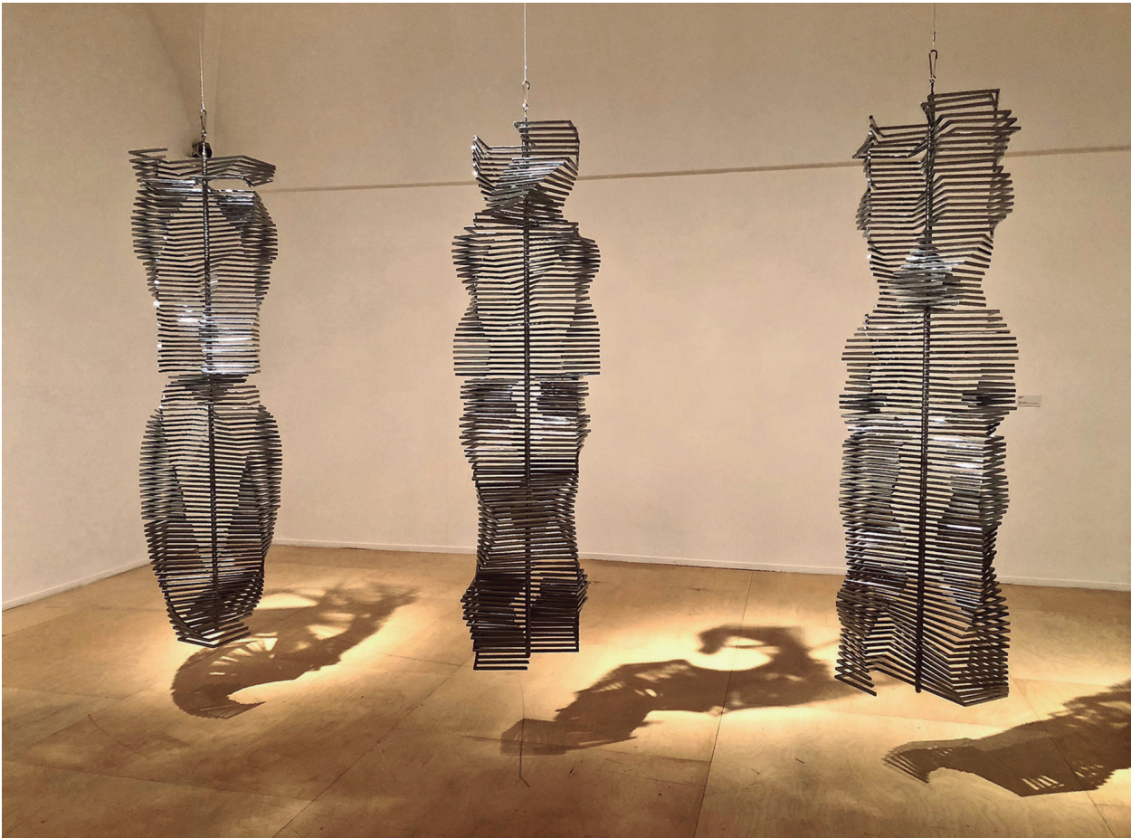
Figura 2. Eusebio Sempere. Columnas (1974). Varilla de acero cromado. Colec. Fundación Juan March. Museo de Arte Abstracto Español. Cuenca.

El diseño, como la tendencia más significativa del arte contemporáneo (García-Garrido, 2010), no tiene diferencia alguna en su vínculo con los conceptos identitarios de la cultura y el territorio. Un problema generalizado de nuestro patrimonio es la pérdida de la idiosincrasia y los caracteres locales, mediante la proliferación de marquesinas y fachadas corporativas de grandes empresas que imponen la uniformidad del paisaje urbano, unido a la despersonalización del mobiliario urbano que se elige de un catálogo internacional y sustituye a los diseños autóctonos y proyectados expresamente para un entorno preciso. Una problemática que si no se afronta con responsabilidad destruirá en poco tiempo el valor único de muchas ciudades y entornos monumentales que se globalizará estética y culturalmente hasta engrosar la despersonalización de su identidad. Llegaríamos a la similitud que pueden tener zonas residenciales conocidas como ciudad dormitorio, en las que no solo no existen caracteres urbanos propios, sino que el desarraigo de sus habitantes a ese territorio no les permite tomar conciencia de comunidad. Una condición que les impide cualquier tipo de manifestación y mucho menos creación inspirada en ese contexto del entorno en que habitan, en su acepción de tener o usar, más que de vivir.