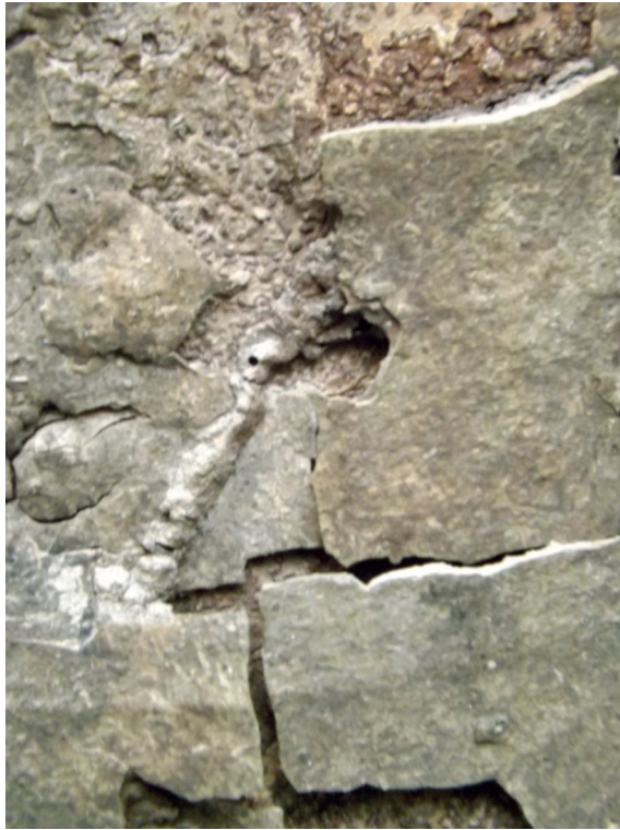
Imagen 3. Gary G.M., Resguardo Nazareth, Amazonas. (2019).