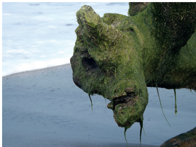
Imagen 1. Gary G.M. Buritaca , Magdalena (2016).