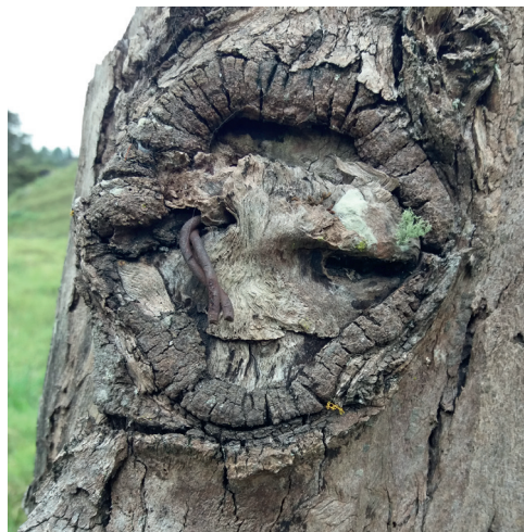
Imagen 2. Gary G.M. San Francisco , Cundinamarca (2018).