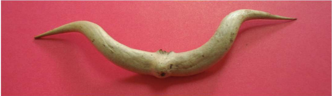
Espina de Mimosaceae donde viven hormigas. Figure 3. Spine of Mimosaceae where ants live.