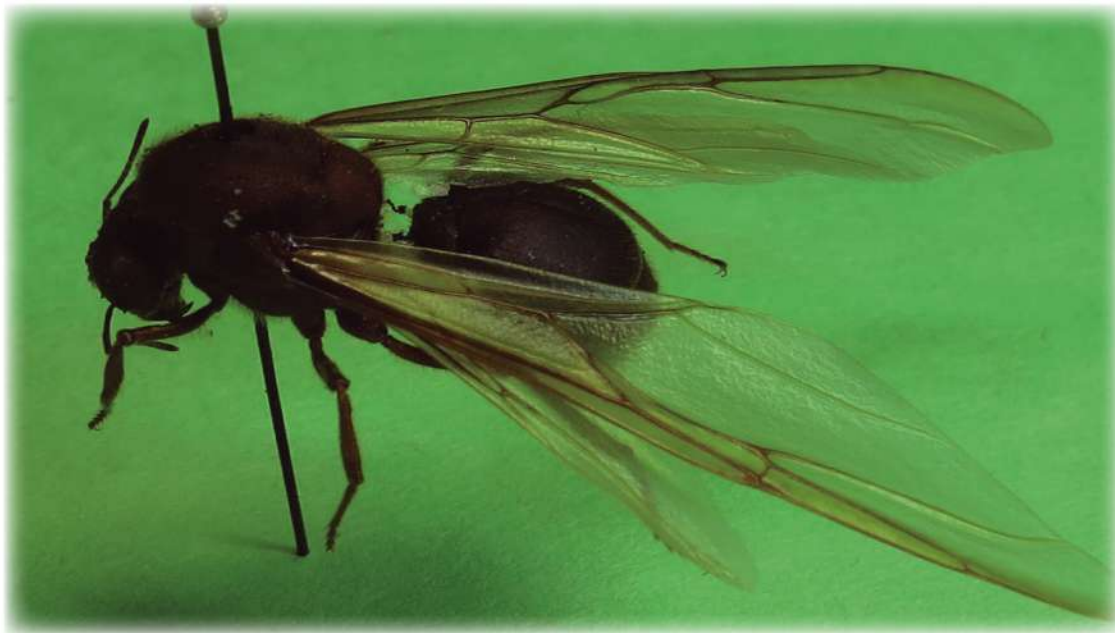
Figure 2. Atta mexicana species.

Empleando las claves taxonómicas que se utilizan para Formicidae, se identificaron las diferentes especies de esta familia que se encuentran depositadas en el Museo de Insectos de la Facultad de Agronomía [hoy Facultad de Ingeniería y Ciencias (FIC)] de la UAT. En el Instituto Tecnológico de Cd. Victoria, en la colección particular de uno de los coautores (Flores, Cd. Victoria, Tamaulipas), en el Centro Universitario de Ciencias Biológicas y Agropecuarias - CUCBA (Vásquez, Zapopan, Jalisco), así como en la UAAAN, se encuentran depositadas las otras especies.