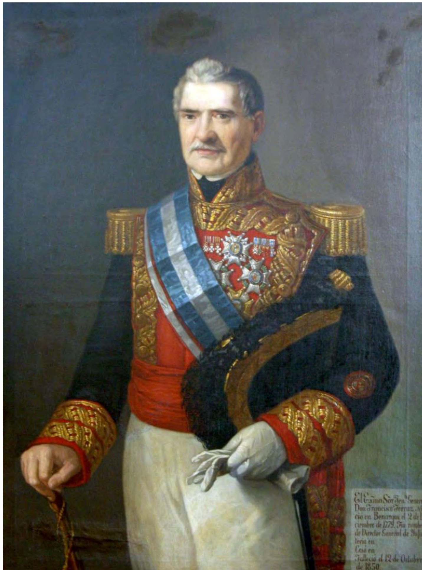
Fig. 5. Retrato del general Francisco Ferraz

Existen al menos tres casos en los que dichos escudos debían colocarse sobre el lado izquierdo del pecho y no en la manga, que tienen en común haber sido aprobados por la Junta Suprema en los primeros meses de la guerra, y que posteriormente acabarían siendo sustituidos por medallas metálicas con un diseño muy similar 19 .