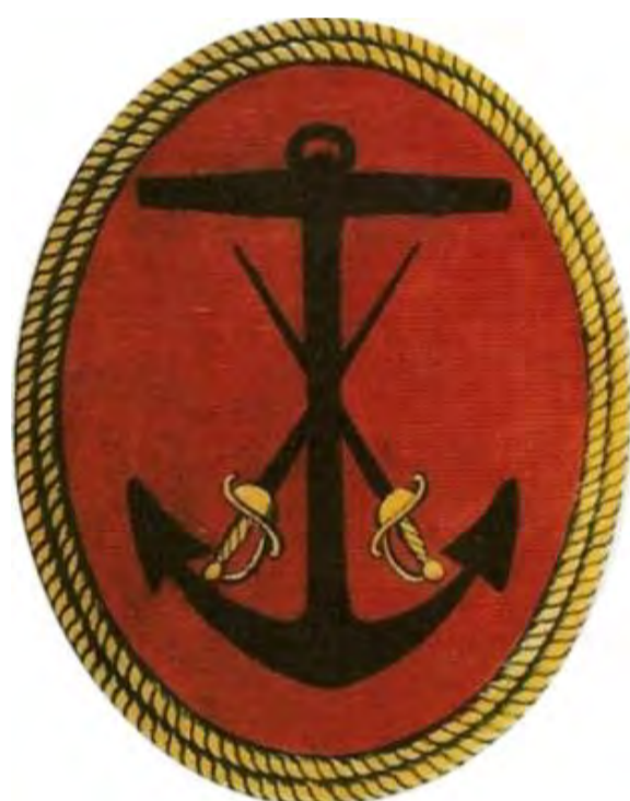
Fig. 1. Matriculados

Finalmente se crearon uno de premio por la batalla de Trafalgar, en octubre de 1805 y otro del regreso de Malta en mayo de 1806 —inspirado en el de Irún de 1794— que en lugar de la cifra real lleva la inscripción FIDELIDAD.