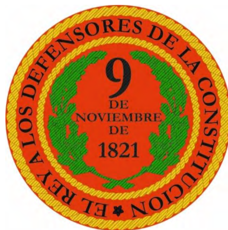
Infografía del autor