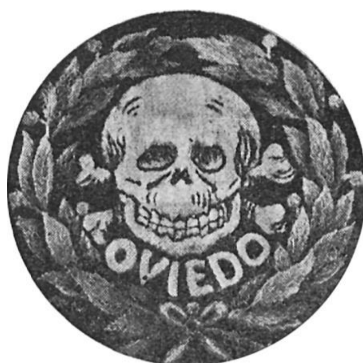
Semanario Fotos 36