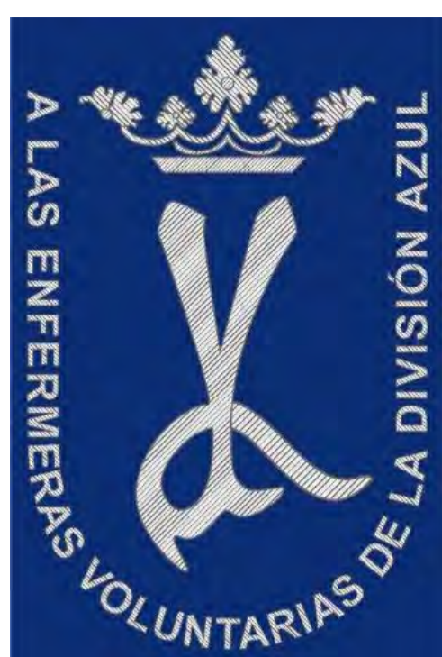
Infografía del autor