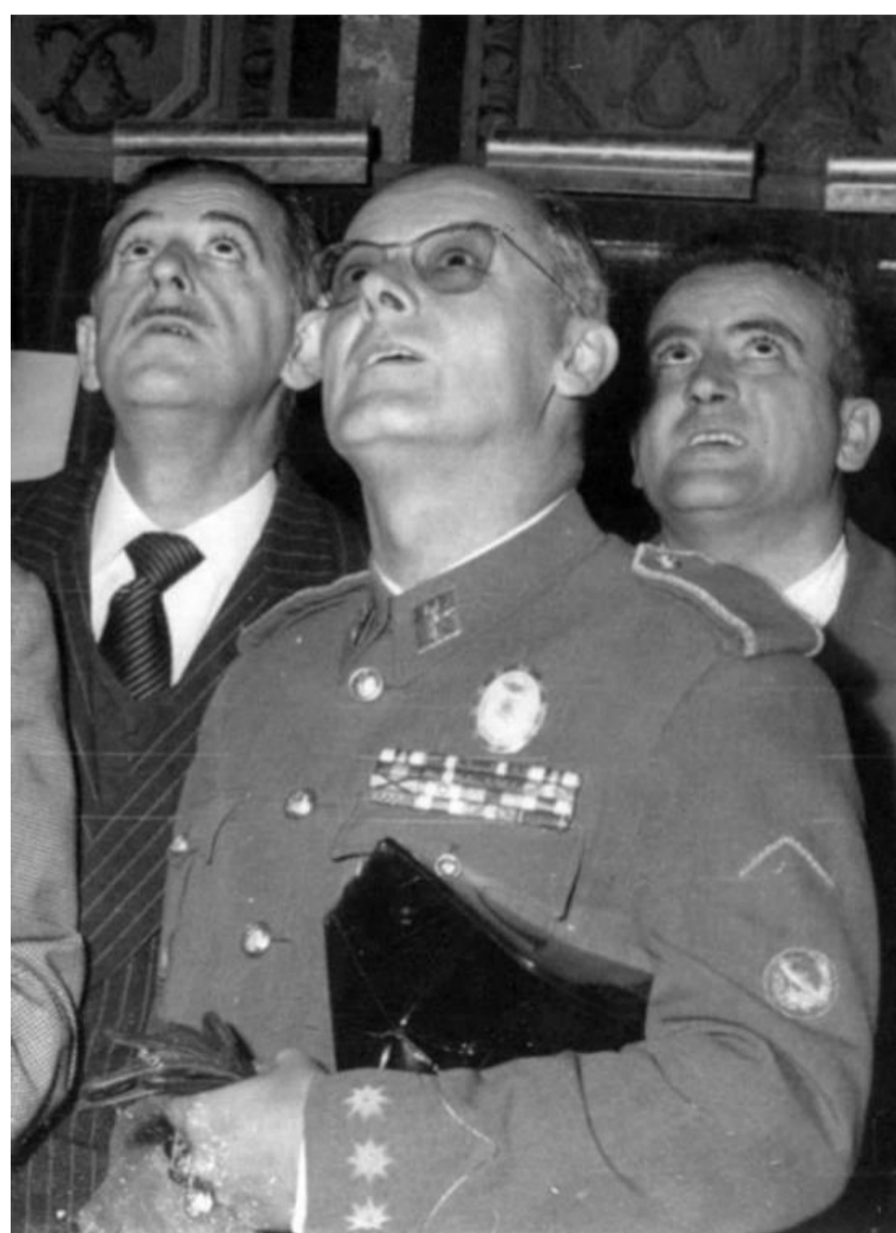
Fig. 43. Uso del distintivo de la ocupación de Ifni. Guardia Civil - Colección particular