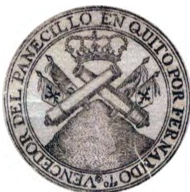
Fig. 17. Panecillo