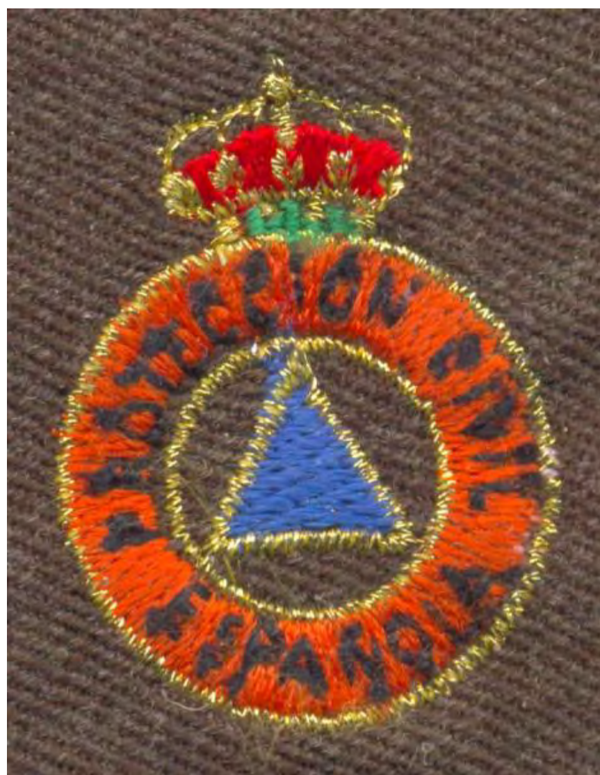
Orden del Mérito Policial Figs. 84 y 85