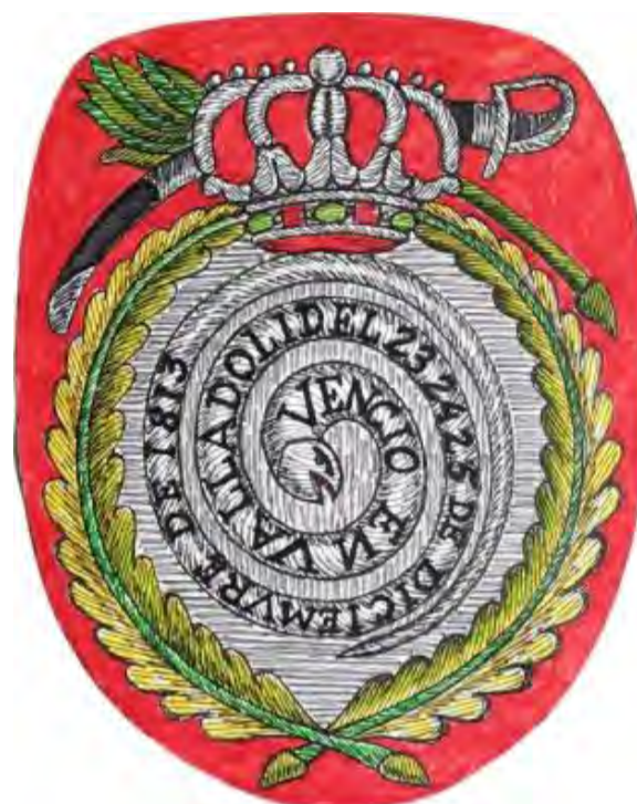
Fig. 14. Valladolid