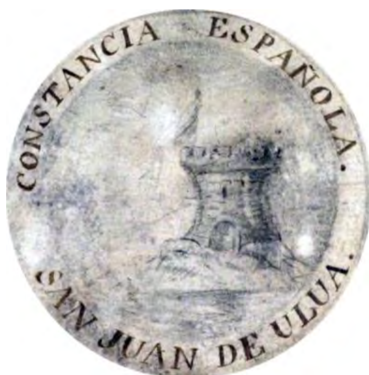
Fig. 15. San Juan de Ulúa