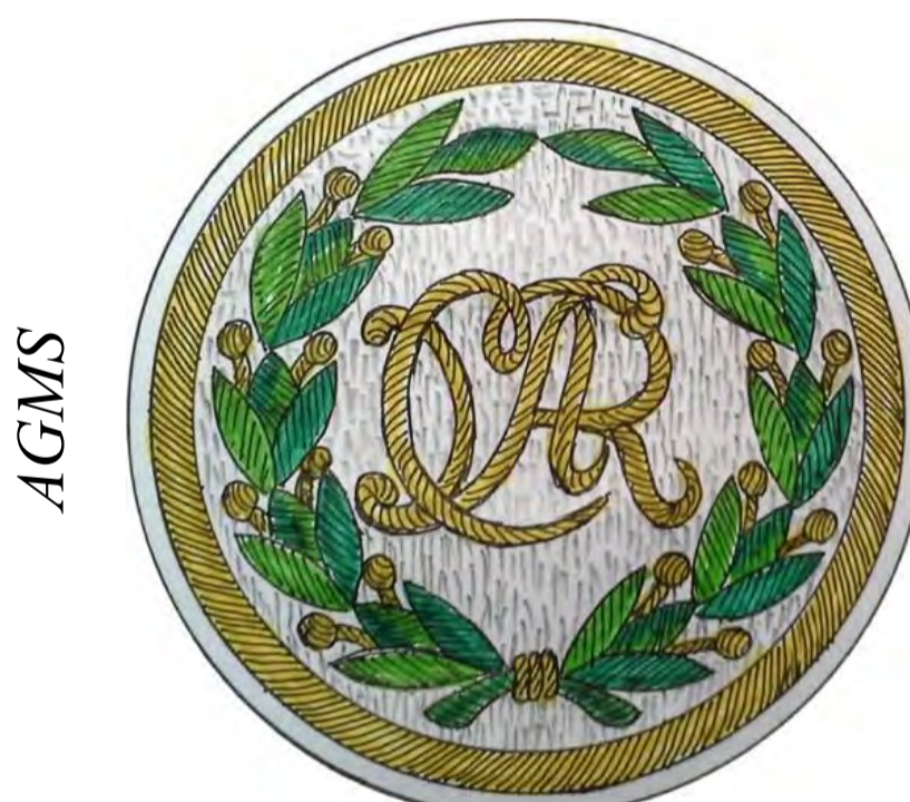
Fig. 4. Defensa de Ferrol