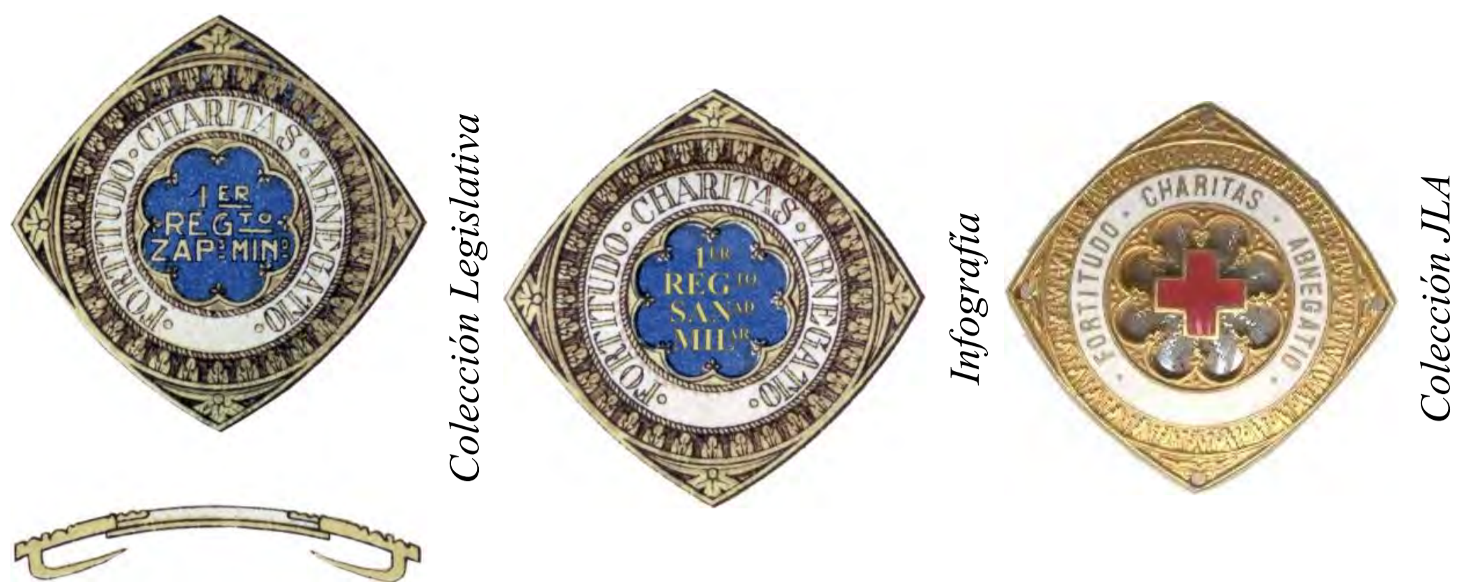
Orden de la Beneficencia