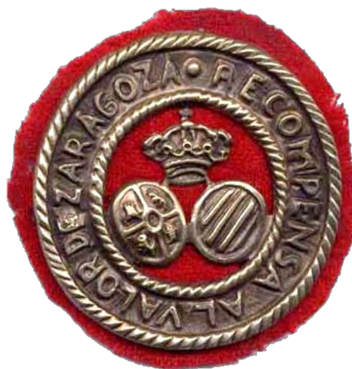
Fig. 6. Escudo de defensor de Zaragoza (Colección LSM)