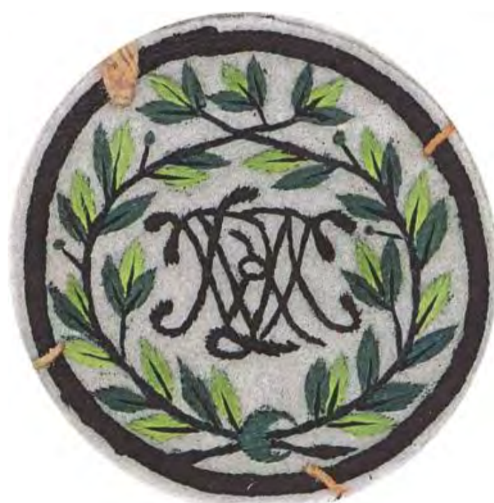
Fig. 3. Paso de Irún