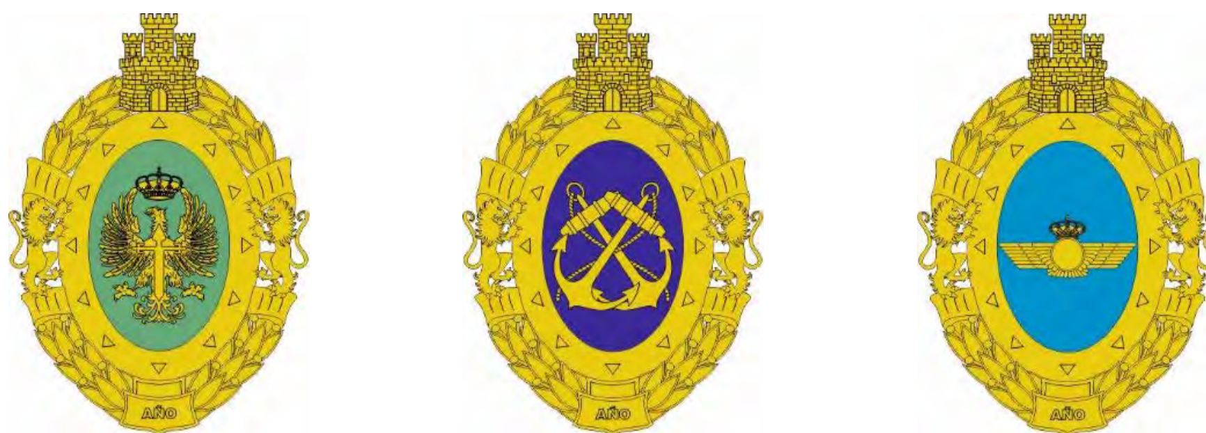
Insignias individuales de las medallas colectivas Fig. 67. Medalla del Ejército. Fig. 68. Medalla Naval. Fig. 69. Medalla Aérea Infografías del autor