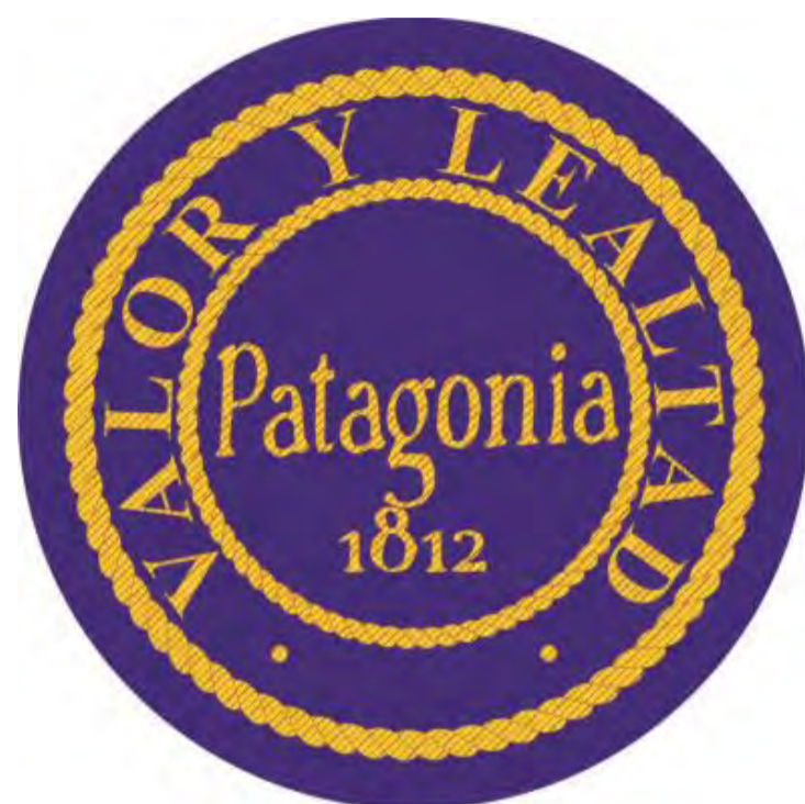
Fig. 13. Patagonia

Teniendo noticia igualmente de un proyecto de ley para otro de constancia en Panamá (1814).