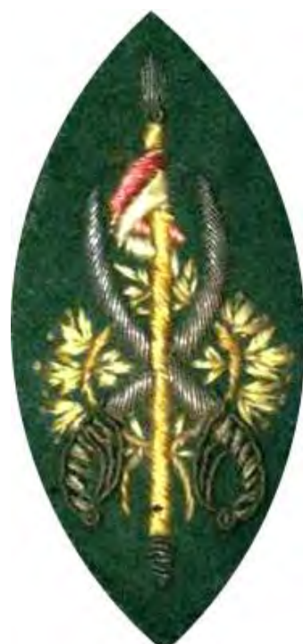
Museo de San Telmo