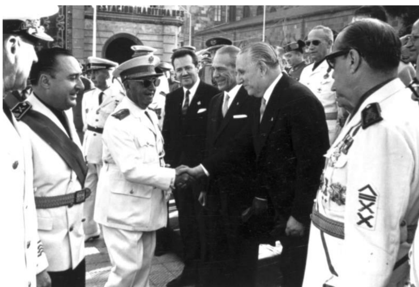
Fig. 83. Llegada de Francisco Franco a Barcelona el 22 de junio de 1966. A la derecha, jerarca de Falange con ángulos y aspas bordados en la manga

Uno de ellos, sobre paño verde de 47 milímetros de diámetro, lleva bordado en hilos de plata la alegoría del anverso de la medalla, que representa el sacrificio por el servicio bajo la tutela del Ángel de la Guarda, con la leyenda AL MÉRITO POLICIAL (fig. 84). Por orden de 4 de diciembre de 1957 (BOE número 313, del 16), se concede con carácter colectivo, a la plantilla de la Policía Gubernativa en Valencia por su actuación durante la inundación sufrida por la capital en octubre de ese año, disponiéndose « que la recompensa pudiera ser ostentada únicamente sobre el uniforme, en el tercio inferior de la bocamanga izquierda, consistiendo en una reproducción en bordado del modelo que se aprobó por orden de 20 de enero de 1945 ». Y otro, que sobre tela azul, lleva bordado en trama de hilos dorados y plateados la Cruz del Mérito Policial que constituye un octógono regular y en el centro una espada vertical adornada de laurel (fig. 85).