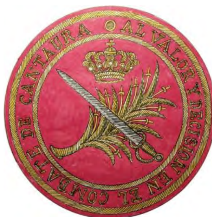
Fig. 16. Cantaura