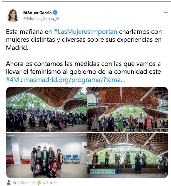
Imagen 3. Ejemplo tuit temática «mujer».