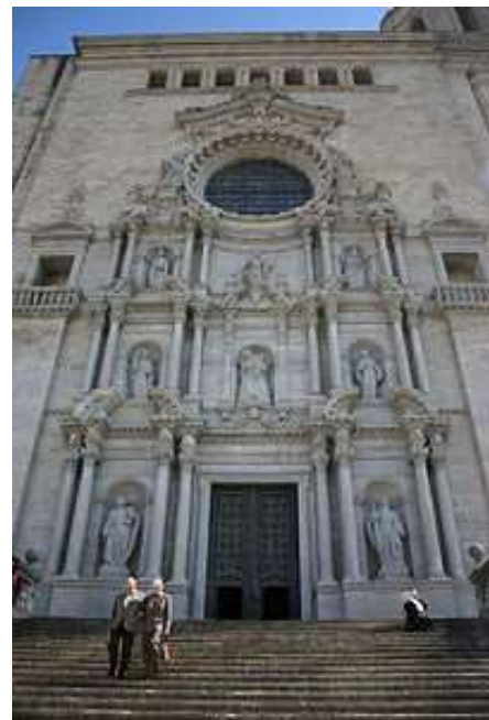
Plano de la Catedral y fachada

En 1312 se formalizó el proyecto. La ampliación del ábside con girola y nueve capillas fue encargada a Enrique de Narbona. A su muerte, siguieron las obras primero Jaime Faverán, y luego Guillermo Cors, Francisco Saplana y finalmente Pedro Sacoma que vio terminada en 1347. Terminada la cabecera, el maestro Guillermo Monry siguió la ampliación del coro, en el tramo que sigue al presbiterio (acabado en 1368). Era necesaria una nave transversal a modo de crucero que uniera esta parte nueva con la planta románica.