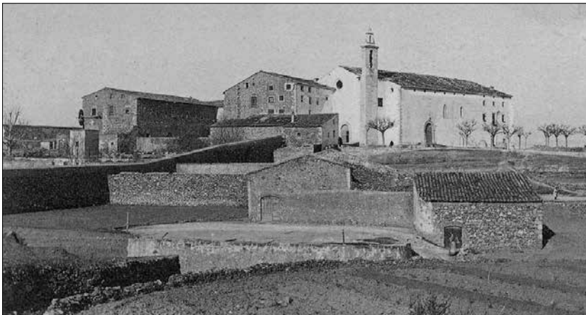
Vista del convent i església de la Serra.

4.- Convent de la Serra . Fou molt detallada la visita en aquest lloc de la vila i les notes que hi prengué l'arquitecte. Quant a l'església, anotà simplement que era «gòtica senzilla amb porta rodona», tot