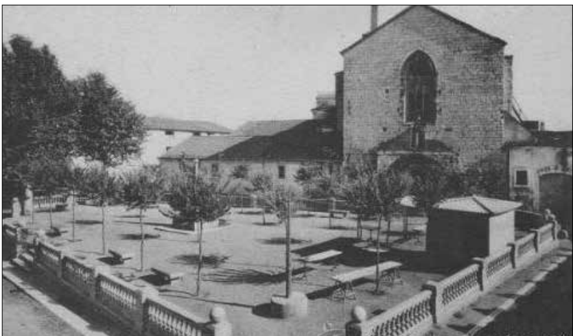
Antiga església de Sant Francesc

La seva sentència final fou: «Està convertit el temple en un dipòsit de botes i tenen intenció de fer-ne solars». Abans d'abandonar aquest lloc encara anotà l'existència d'escut de la vila situat al «cantó de la porta», especificant que estava constituït per una flor de lis dalt d'un mont amb quatre barres al fons. En feu el corresponent dibuixet. Trobà un altre escut que no pogué identificar a qui pertanyia. 21