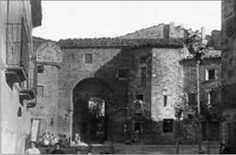
Portal de la Muralla.