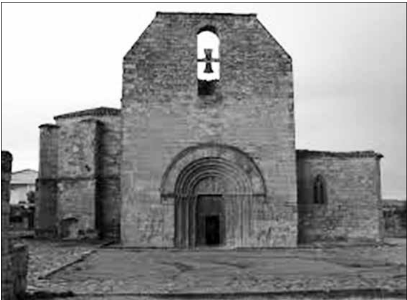
Església de Santa Maria de Bell-lloc.

2.- Església de Santa Maria de Bell-lloc .- Com és natural l'arquitecte no podia deixar de visitar l'església de Santa Maria de Bell-lloc , la capella protegida dels Queralt, situada fora muralles, a poca distància, i a llevant de la població. 34 D'aquesta església en destaca la portalada que tenia «arcs plans de mig punt i toros alternats i tots ells finament decorats». Precisament, per aquest motiu apuntà: «cal fer-ne molts detalls». I continuà: «En les dovelles hi ha motius dins cercles iguals als dels teixits de l'època. En uns s'hi veuen dos lleons o dos aligots enfrontats, en altres carxofes de fullatge, en altres llaceries entallades, etc. En el trumeau hi ha l'adoració dels tres reis. La mare de Déu al mig amb Jesús al seu