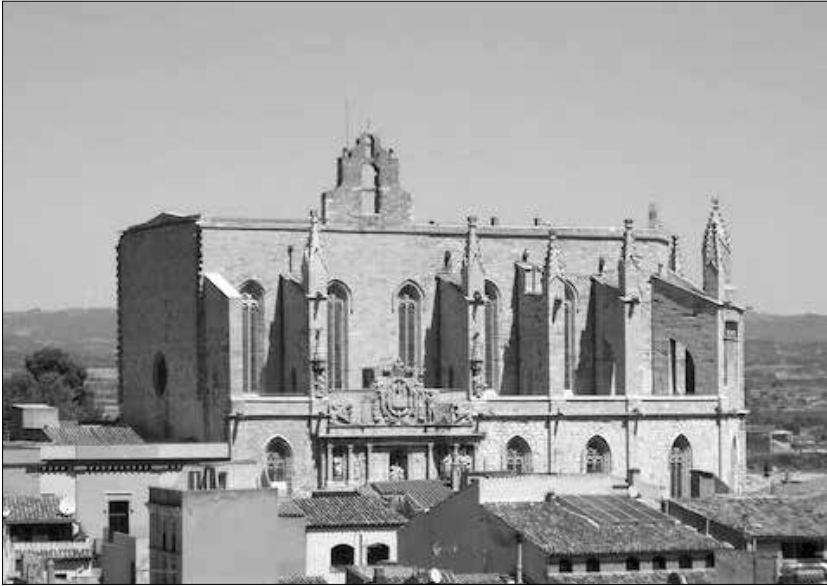
Església de Santa Maria de Montblanc

un de gran davant de la porta, i dos de petits, un a cada costat».