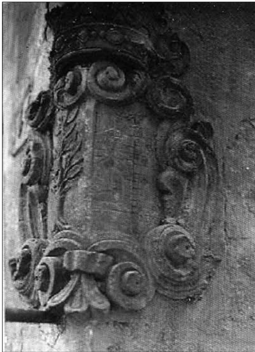
Escut de cal Flavià, situat on antigament hi havia el molí d'oli del senyor.

L'arquitecte, inspeccionada i valorada la primera planta del castell, torna a la planta baixa, on escriu que «hi ha un seguit de dependències, trulls, dipòsits, cambres, etc., coberts amb voltes», per passar a descriure el brocal de la cisterna: «En el centre del pati hi ha el templet de la cisterna, que també és de pedra, però molt senzill.» Curiosament no fa cap altre comentari a l'àngel Sant Miquel que la coronava, obra d'especial interès elaborada per l'anomenat «Mestre del Tallat», estudiat recentment pels historiadors de l'art Joan Yeguas i Damià Amorós 31 i que actualment es conserva en un lloc preferent a la planta baixa de l'edifici «La Societat» de la població.