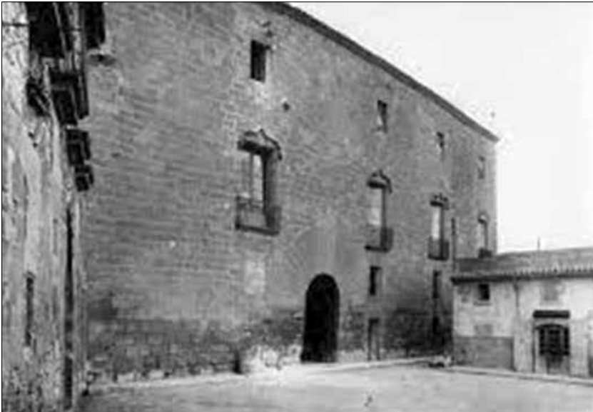
Castell dels comtes de Santa Coloma de Queralt.