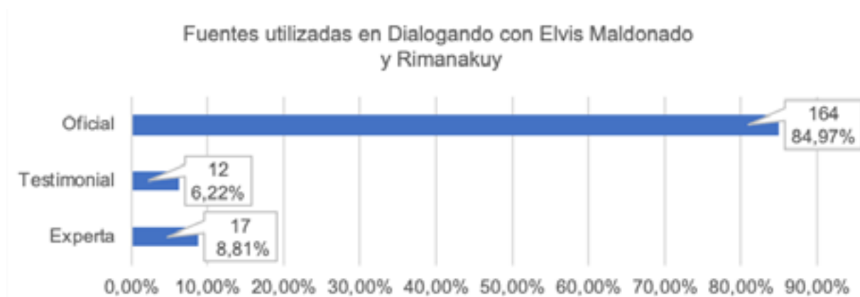
Representación 4 Proceso inferencial del contenido (estándares)