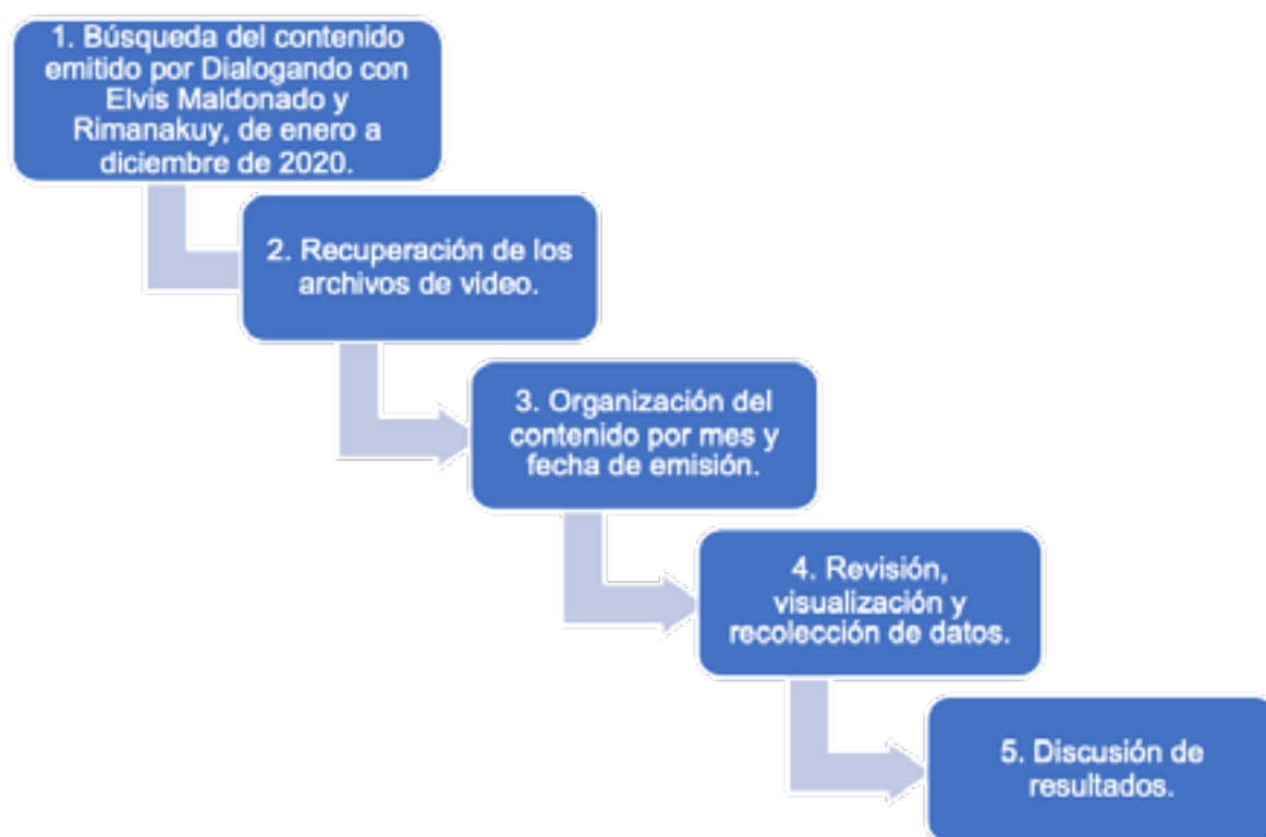
Representación 1 Fases del proceso de análisis de contenido de los programas televisivos de Puruwa TV

La revisión constó de cinco fases (representación 1): 1. En la fanpage de Puruwa TV hay 250 archivos pertenecientes a Dialogando con Elvis Maldonado y 185 archivos correspondientes a Rimanakuy. 2. Recuperación de los archivos de video mediante la creación de carpetas en la nube. El analista está en la libertad de elegir la forma de recolección que mejor se acople a su investigación, Gil (2016) plantea que aquellos recursos electrónicos pueden constituirse el medio pertinente para la recolección y recuperación de información. 3. La organización del contenido por mes y fecha de emisión comprende un proceso de orden y verificación cronológica, que como describe Gil, desarrolla un registro de inspección y facilitación del tratamiento del contenido. 4. La revisión, visualización y recolección de datos son el eje central de las fases del análisis de contenido, por la generación de datos para la información que bajo metodología cuantitativa permitirá exponer la siguiente etapa. 5. La discusión de resultados son consecuencia de la fase 4, permitiendo explicar y contextualizar lo hallado, que al mismo tiempo debe ser presentado en correlación con el sustento teórico.