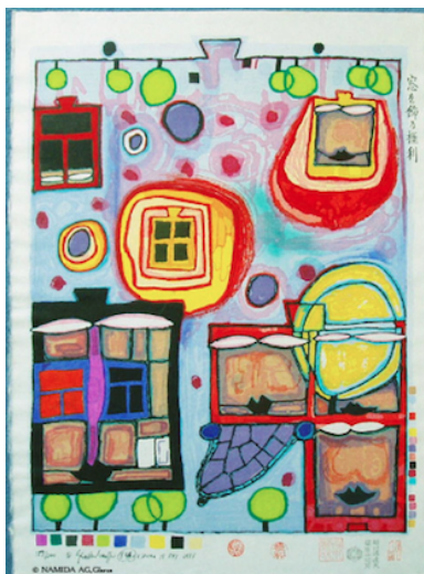
Figura 4. Window Right 1986 (Fuente: Rand, 2012)

La figura 3 está estructurada horizontalmente. En la parte inferior se aprecia un conglomerado de tierra y un río con un puente que conecta a un edificio. En la base de los edificios se logra ver lo que parecieran ser rostros, en los siguientes niveles se aprecian ventanas azules yuxtapuestas con copas de árboles en edificios de diversos colores, representando esta idea de respetar a los inquilinos que habitan el lugar en donde decidimos vivir y modificando lo menos posible el espacio. Más arriba, en el costado izquierdo, se logra observar lo que pare ser un parque mientras que, del lado derecho, azoteas verdes. En el centro de la parte superior, se aprecia un arco gris. En el fondo se muestran líneas curvadas naranjas con azul, a manera de espirales, las cuales están acompañadas por árboles flotantes.