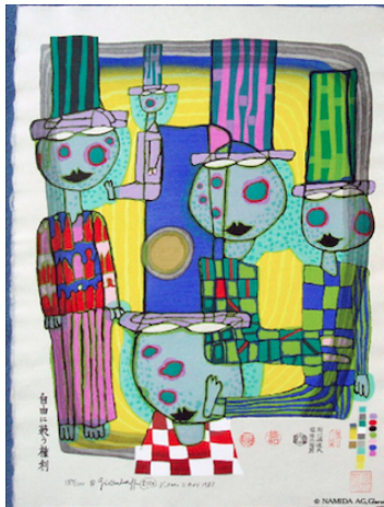
Figura 2. The Second Skin 1986

2. Las ropas: podrían entenderse como el estatus social, genera diferencia entre individuos de manera reversible (Restany, 2001). Esta segunda piel es el ropaje e investidura; es decir, aquello que se adquiere y que se relaciona con lo otro, con la diferencia y la alteridad. Representa al ser como construcción social, ubicando al sujeto en el espacio público en su relación con los otros (Palacio, et al., 2016).