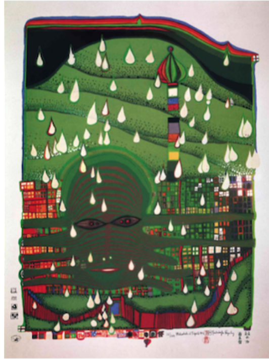
Figura 6. Green Power 1972 (Fuente: Rand, 2012)

En la figura 6 se hace referencia a la naturaleza y su poder. La obra se estructura de manera horizontal, en la parte inferior se pueden ver altiplanos verdes, con un río, haciendo referencia a la Tierra. Posteriormente, se aprecian ventanas superpuestas de distintos colores que se pierden en un verde imperioso, pues la ciudad es absorbida por la naturaleza de forma armónica, como parte de su ideal de realizar las menores alteraciones posibles a los ecosistemas en donde se construyen los centros urbanos.