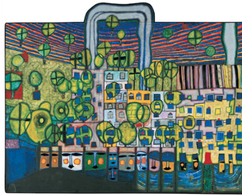
Figura 3. The Third Skin 1982

3. Las casas: El artista cuestiona la arquitectura en general, por lo que con su propuesta busca romper con las líneas rectas, respetando al medio ambiente como prioridad. Esto lo lleva a incorporar en el interior-exterior, árboles y plantas, formando así parte de las mismas estructuras arquitectónicas. Por otro lado, Hundertwasser pone énfasis en el derecho a la ventana, que se basa en la idea de que el individuo tiene la prerrogativa de diseñar su propio espacio (Restany, 2001). Esta tercera piel es el lugar en donde se vive, el que se habita.