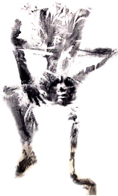
Figura 11. Ídolo I , pigmento sobre pellón, 60 x 100 cm., 2017.