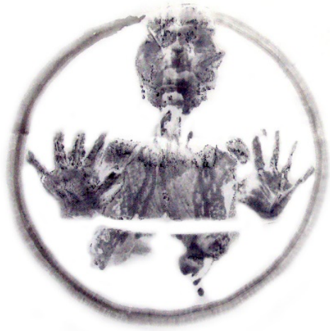
Figura 8. Entambada , pigmento negro sobre pellón, 90 x 100 cm., 2017.

Respecto a este fenómeno, la investigadora Estelle Tarica le llama contravictimización :