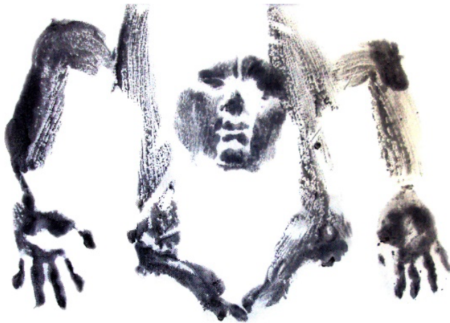
Figura 10. Diosa II , pigmento sobre pellón, 45 x 60 cm., 2017.

como ente simbólico y no como matérico, como ocurría en la representación de los personajes del mural.