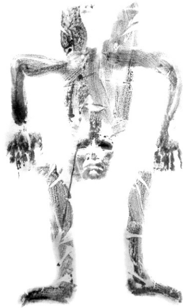
Figura 12. Ídolo II , pigmento sobre pellón, 60 x 100 cm., 2017.