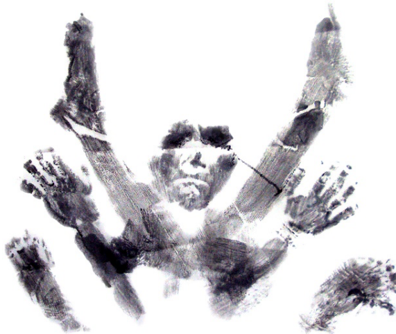
Figura 9. Diosa I , pigmento negro sobre pellón, 45 x 60 cm., 2017.

De manera que involucrar mi testimonio, es situarme, y no sólo a nivel espacio, sino a nivel de cuerpo, reclamándolo