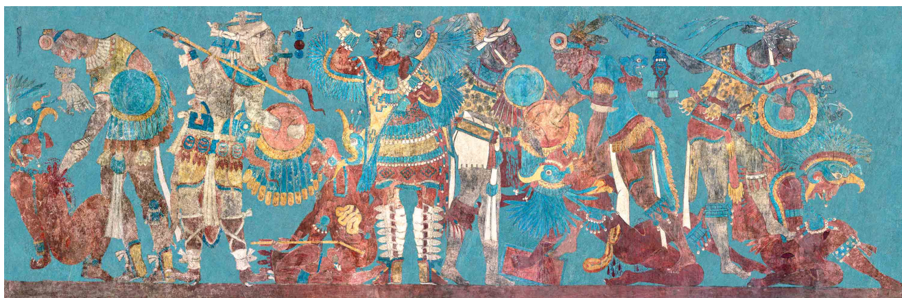
Figura 1. Talud oriente del mural La Batalla , Cacaxtla, Tlaxcala, México (Reconstrucción digital).

Empezaré por hablar de un talud prehispánico, el cual pertenece al mural titulado “La Batalla” (figura 1), cabe destacar que este fragmento fue seleccionado debido al uso de violencia corporal que representa y a su óptimo estado de conservación. Éste se encuentra ubicado en el Edificio B de la Zona Arqueológica de Cacaxtla, en el estado Tlaxcala, México, a simple vista, esta imagen se compone de once cuerpos en batalla, divididos en dos grupos; el primero de ellos, conocido como los vencedores , son cuerpos ricamente ataviados como jaguares, todos ellos de pie (excepto por el personaje izquierdo de la pareja central), con expresiones amenazantes y portadores de cuchillos de pedernal, lanzas y escudos.