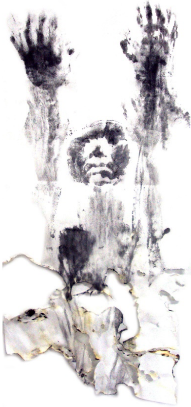
Figura 7. Calcinada , pigmento negro sobre pellón, 50 x 80 cm., 2017.

Ahora bien, el cuerpo del mural también es un cuerpo desmembrado, desollado, destripado, pero la finalidad no es su desintegración. En él, el cuerpo ocupa una posibilidad de presencia simbólica por medio del mural, incluso como menciona Jesús Galindo una vez más en Uriarte, el mural fue “...concebido, para que la gente congregada, en una de las plazas más importantes de la ciudad, admirará y fuera testigo de cómo el discurso pictórico...” (Uriarte, 2013, pág. 134) lo que manifiesta la amenidad continua por representar dichas formas en un espacio pensado, quizá, para su posible transcendencia, lo que vence a la idea de una muerte enmudecida y traslada a la vida a una imagen. Este discurso sería haría presente en piezas como Diosa I (figura 9), Diosa II (figura 10), Idolo I (figura 11) e Idolo II (figura 12).