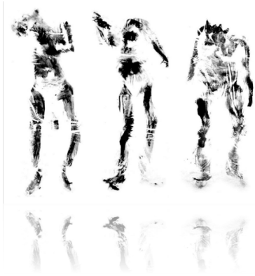
Figura 5. Somas (fragmento) . Pigmento sobre pellón, 150 x 150 cm. 2017.

Esta práctica artística consistiría en reapropiarme de mi cuerpo y someterlo, una vez entintado, a reconfigurar la violencia e incluso las posiciones corporales del mural (Figura 5) por medio del graphein un verbo en griego designado a la acción de figurar, sin una distinción entre la acción de dibujar, pintar o estampar. Es a partir de aquí donde surgirían obras como ahogada (figura 6), calcinada (figura 7) y entambada (figura 8), huellas del ocultamiento del cuerpo en la violencia actual, mismas que al ser evocativas de la presencia de un cuerpo, no lo borrarían, sino que harían hincapié en su corrupción.