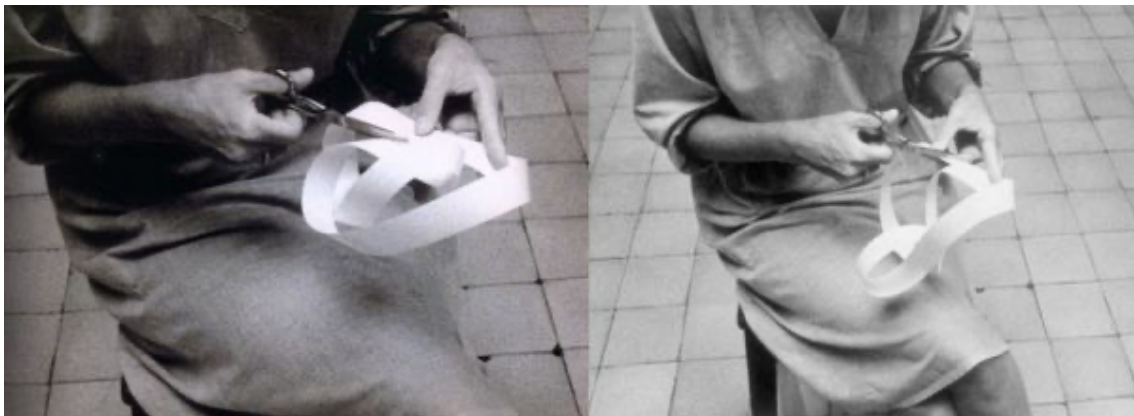
Figura 1. Clark, L. Caminhando , 1963.

Lygia Clark representó este problema ontológico que enfrenta la pedagogía de manera metafórica y alegórica en su performance Caminhando . Simbolizando al cuerpo estético y al conocimiento como productor de significado en un mismo plano de inmanencia, ambos son una fragmentación continua con respecto a su finalidad preestablecida.