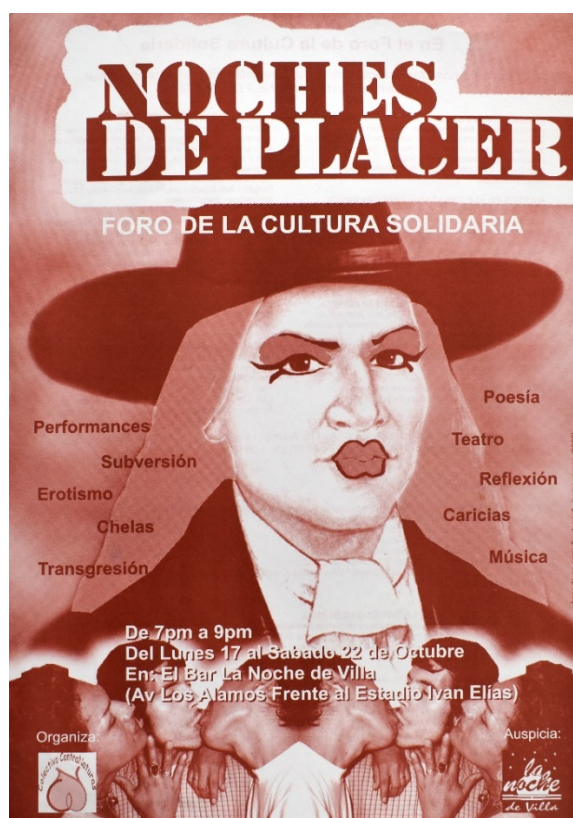
Figura 1. Afiche “Noches de placer” para promocionar las actividades del Colectivo ContraNaturas durante el II Foro de la Cultura Solidaria en Villa El Salvador 2005.

se distingue a dos chicos que se besan mientras una travesti acaricia a uno de ellos, esta imagen está duplicada al espejo y ocupa todo el ancho del diseño. Sobrepuesto a este conjunto se informa los días, hora y lugar del evento. En la esquina inferior izquierda después de la palabra “Organiza” se ve el logo del Colectivo ContraNaturas y en la esquina inferior derecha bajo la palabra “Auspicia” el logo del bar La Noche de Villa . En letras muy pequeñas se lee en el extremo derecho y de manera vertical “basado en serie xx-tupas, Javier Vargas (2005)”. 11 En la contracara del volante se detalla la programación de las actividades del colectivo durante la semana del FCS 2005 (figura 1).