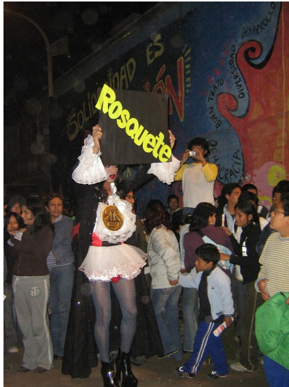
Figura 2. Registro fotográfico de acción de “Las Tupis” en las afueras del Teatro Vichama, durante el III Foro de la Cultura Solidaria en Villa El Salvador 2006.