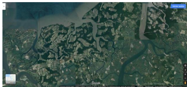
Figura 3 . Piscinas de camarones y área de manglar en Archipiélago de Jambelí

Por lo tanto, una de las principales opciones históricas y de tipo técnico para la preservación y manejo del manglar lo representa la producción de la concha prieta, en conjunto con el cangrejo rojo ( Ucides occidentalis ) y otras especies del manglar, las cuales permiten su aprovechamiento económico y social con un mínimo impacto ambiental, si se realizan adecuadamente las labores productivas (Carchi et al., 2019).