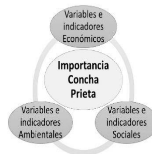
Figura 1. Esquema de variables e indicadores para el análisis de la importancia de la concha prieta en el Ecuador.

En este apartado, se presentan y analizan los resultados de la información relativa a la importancia de la producción de la concha prieta ( Anadara tuberculosa ), lo cual se pone de manifiesto a través de variables e indicadores de tipo económico, social y ambiental (Figura 1)