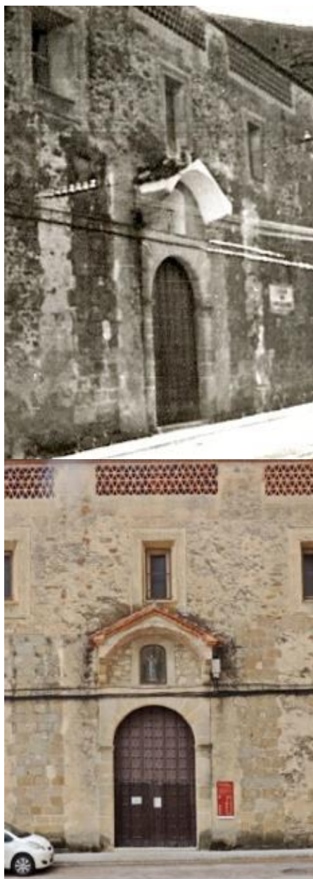
Detalle de foto de 1979 que muestra el convento antes de su restauración y foto posterior a la misma.

La iglesia o ermita 85 de San Miguel tenía testero a la plazuela y entrada lateral por el lado de la Epístola, vale decir, por la calle Tintorerros.