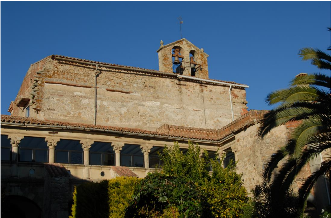
Detalle de la portada del primitivo convento en la Calle Tintoreros

San Miguel, a lo largo de los siglos esta familia estaría muy vinculada al monasterio de religiosas dominicas de San Miguel y Santa Isabel ubicado en los inicios del siglo XVI aprovechando la ermita existente como iglesia conventual, allí fueron enterrados y se conservan algunas lápidas con los escudos de los Hinojosas y Valverdes, pues los Cascos se reconocían deudos con estas familias, fundadores del cenobio 82 . Por ejemplo, Gonzalo Casco el 28 de junio de 1546 sale fiador