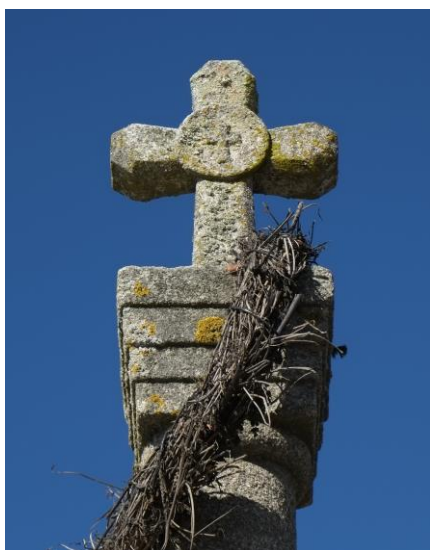
Detalle del Crucero, Barrio de Portugal

En el año 1593 se deslindó el término de Trujillo por este sitio y aparece Miajadas (lugar de Medellín) con sólo su egido por límite de Escurial. En el año 1627 el rey Felipe III mandó vender siete lugares de Trujillo para atender a los enormes gastos que las guerras le ocasionaban cupo en suerte la de Escurial. El pueblo no quiso que se hiciese su venta a ningún particular sino que reunidos los principales de su vecindario y el pequeño concejo que le administraba, nombraron a don Bartolomé Borrallo, para que gestionara la venta del pueblo, consiguiéndolo y quedando la villa libre con jurisdicción propia civil y criminal, por 16.000 maravedíes por vecino y 6400 ducados por legua de término, adquiriendo dos leguas o