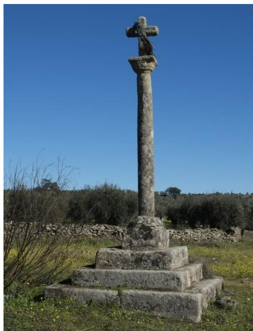
Cruz de Corralejas

al fuste un cierto atractivo artístico en la solidez de la piedra, rematando en un capitel y pequeña cruz sobre la que absurdamente se ha colocado otra de forja moderna. Es obra del siglo XVIII. Es una lástima que todas las cruces además de sufrir el “mal de la piedra” están cubiertas de líquenes. Todas