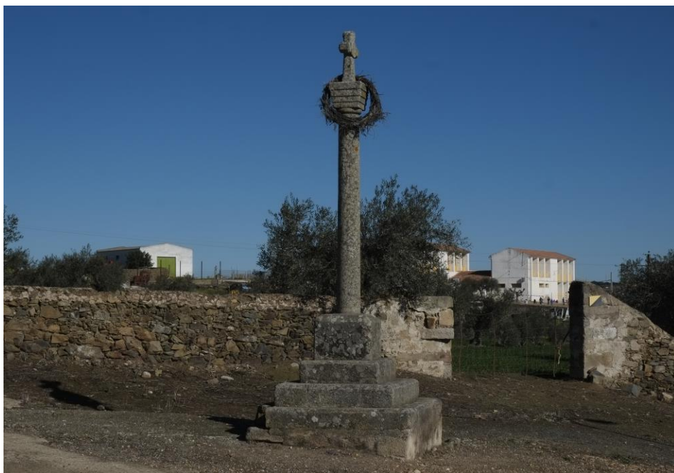
Crucero, Barrio de Portugal