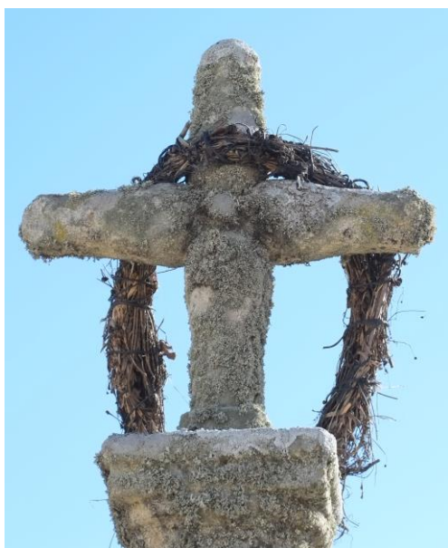
Crucero Pozo Hondo y detalle de la cruz