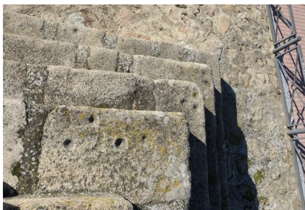
Cruz (camino a Guadalupe) y detalle

villa. El 21 de marzo de 1809, durante la Guerra de la Independencia, tuvo lugar en Miajadas la Batalla de la Degollada, donde las tropas del capitán Henestrosa consiguieron derrotar al ejército napoleónico. A la caída del Antiguo Régimen la localidad se constituye en municipio constitucional en la región de Extremadura, desde el año 1834 quedó integrado en el Partido Judicial de Trujillo.