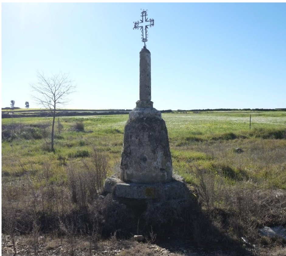
Cruz, Camino de la Palanca

de sarcófagos antropomorfos excavados en los granitos del término municipal. Sobre este contrapeso se alza la cruz, con basa con