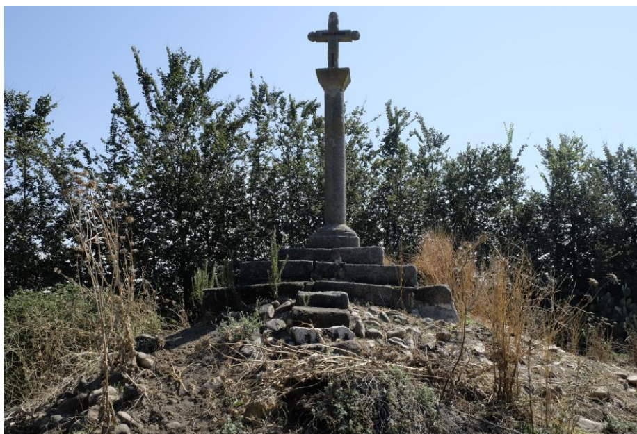
Cruz de la Vega

finca “Casa de la Vega” y en sus proximidades. El caserío conserva oratorio, magnífico cortijo e inscripciones romanas localizadas en la zona que determina la existencia de una necrópolis y una villa romana, a juzgar por los restos de abundantes sillares encontrados en la “Cerca de los Hidalgos”, que salieron a la luz tras las excavaciones realizadas en los años 60 del siglo XX por don Carlos Callejo 38 . Precisamente, en la finca “Casa de la Vega” se han localizado importantes restos visigodos, destacando una pilastracancel de mármol blanco decorada con círculos secantes y entrelazados que contienen en su inte-