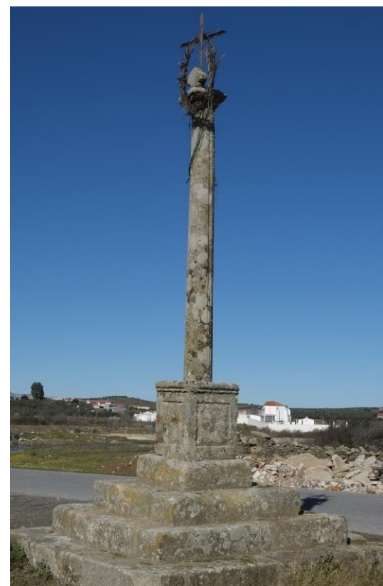
Crucero del Retamal

Se alza a poca distancia de la población en el camino del Prado, a la entrada por el camino de Villar