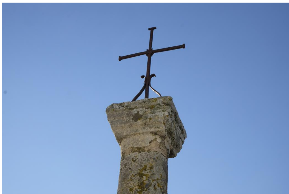
Crucero Ermita de Santa Filomena y detalle de la cruz

la señal de una tradición cristiana muy arraigada en nuestra cultura.