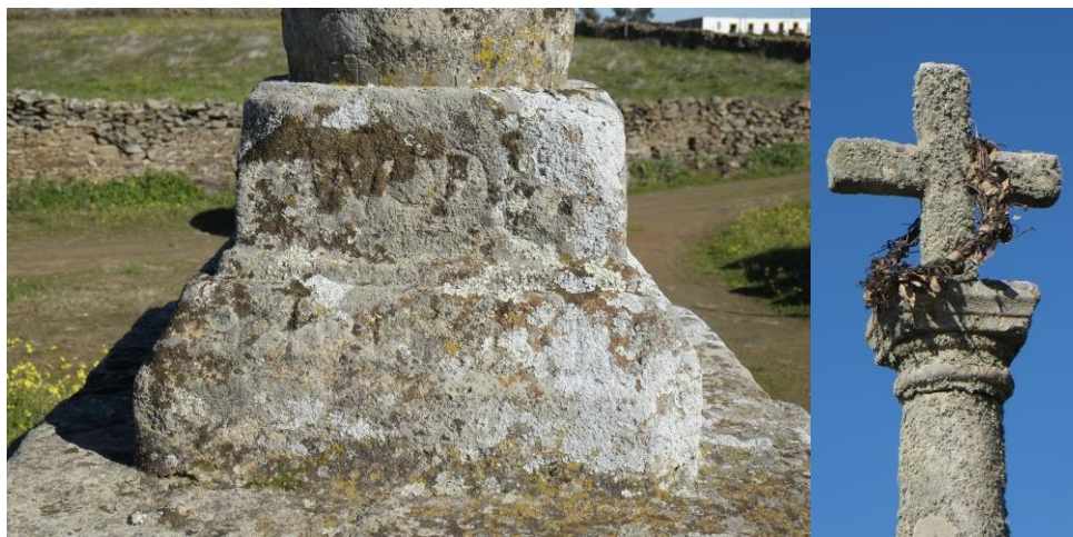
Detalle de la inscripción, fecha 1768 y detalle cruz

de Rena. Es magnífico crucero que se levanta sobre cuatro gradas cuadrangulares y base cúbica bien trabajada en todos sus lados, columna lisa pero con una pequeña acanaladura incisiva que imprime