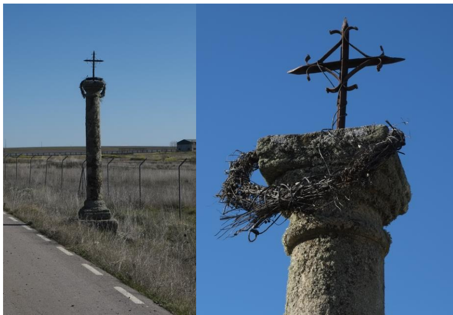
Cruz de los Arenales y detalle