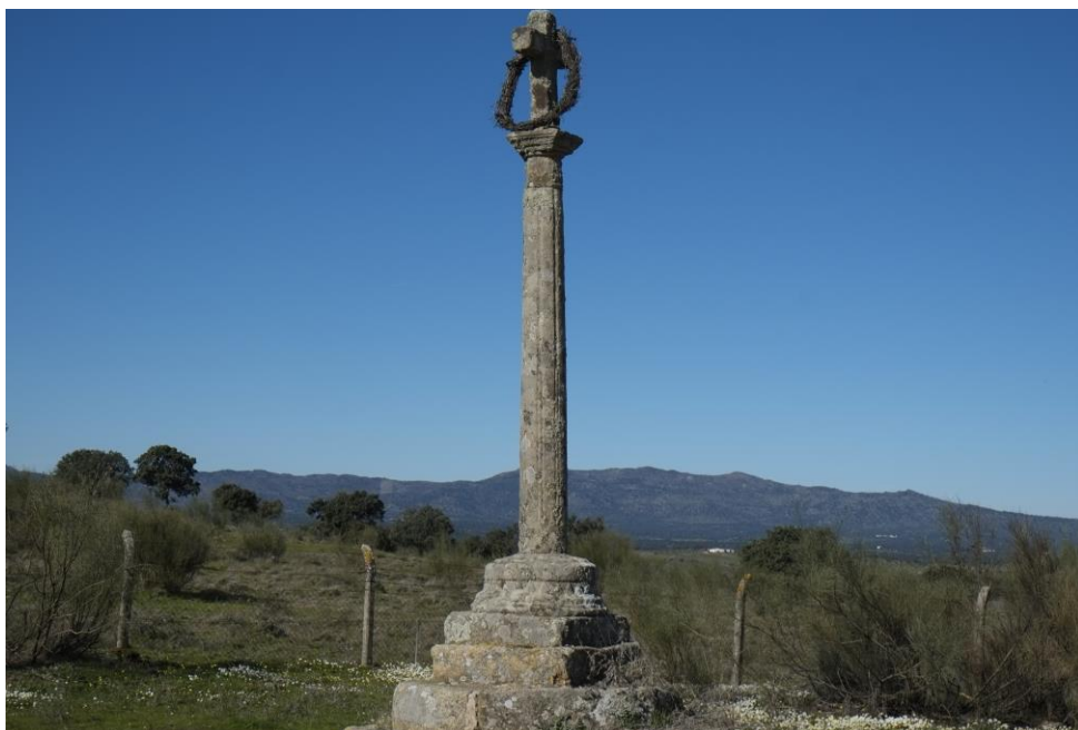
Crucero de Abud