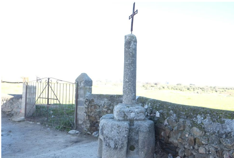
Crucero de la Cruz