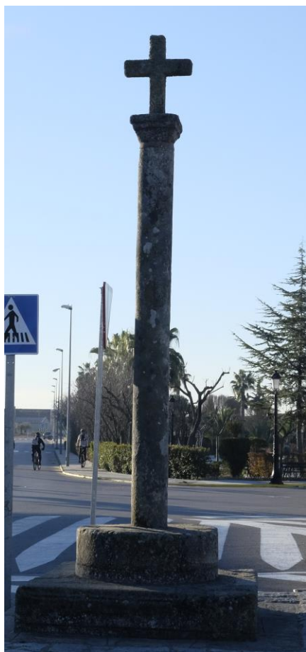
Cruz de la Vega

Junto al camino de las Zorreras está la Cruz de la Vega. Símbolos de piedad popular hoy en desuso, pero que forman parte de nuestra historia y son indicativos de la actitud con que, en otros tiempos, se salía a los caminos o se retornaba de ellos. Con frecuencia eran objeto de breve oración para suplicar amparo ante los peligros del camino incierto que se