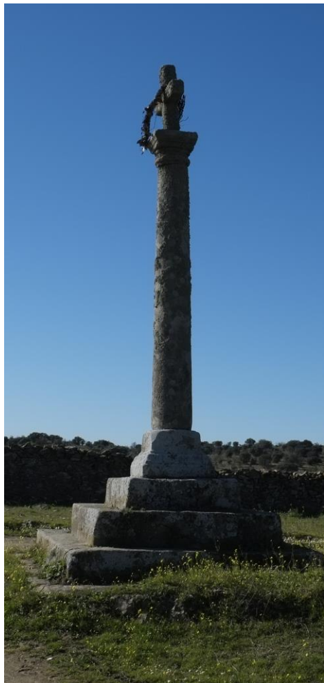
Crucero de Mingo Bernardo

sin decoración que remata en un collarino y capitel de vaso liso. Es obra de 1768 según reza en la base del crucero. Conformando todo el conjunto una agraciada estampa.