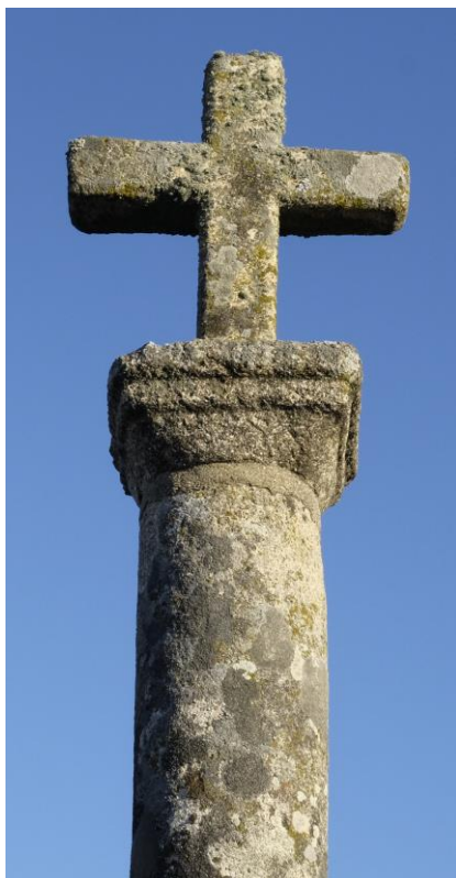
Detalle de la Cruz de la Vega

comenzaba o para dar gracias por culminar con éxito del que se regresaba. Allí está el Parque dedicado a la Constitución Española con motivo de su 25 aniversario. Junto al mismo, abrevaderos y lavaderos de piedra que sirven ahora para el juego de los críos pero que antaño fueron de inesti-