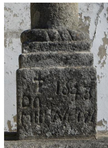
Cruz del Siglo y detalle de la base