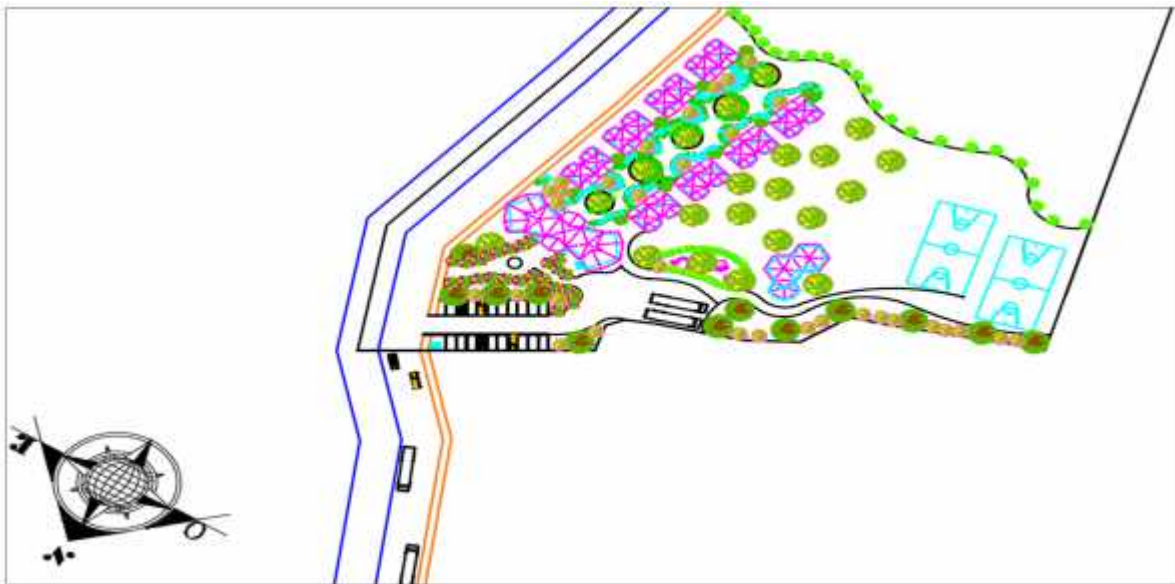
Ilustración 1 Diseño del Centro turístico comunitario

Área de alojamiento: Se construirán 8 cabañas de 268 m 2 cada una. Las cabañas tendrán dos ambientes independientes, una habitación matrimonial y una habitación familiar; la capacidad máxima por cabaña es de 8 plazas. En total se podrán hospedar hasta 64 personas.