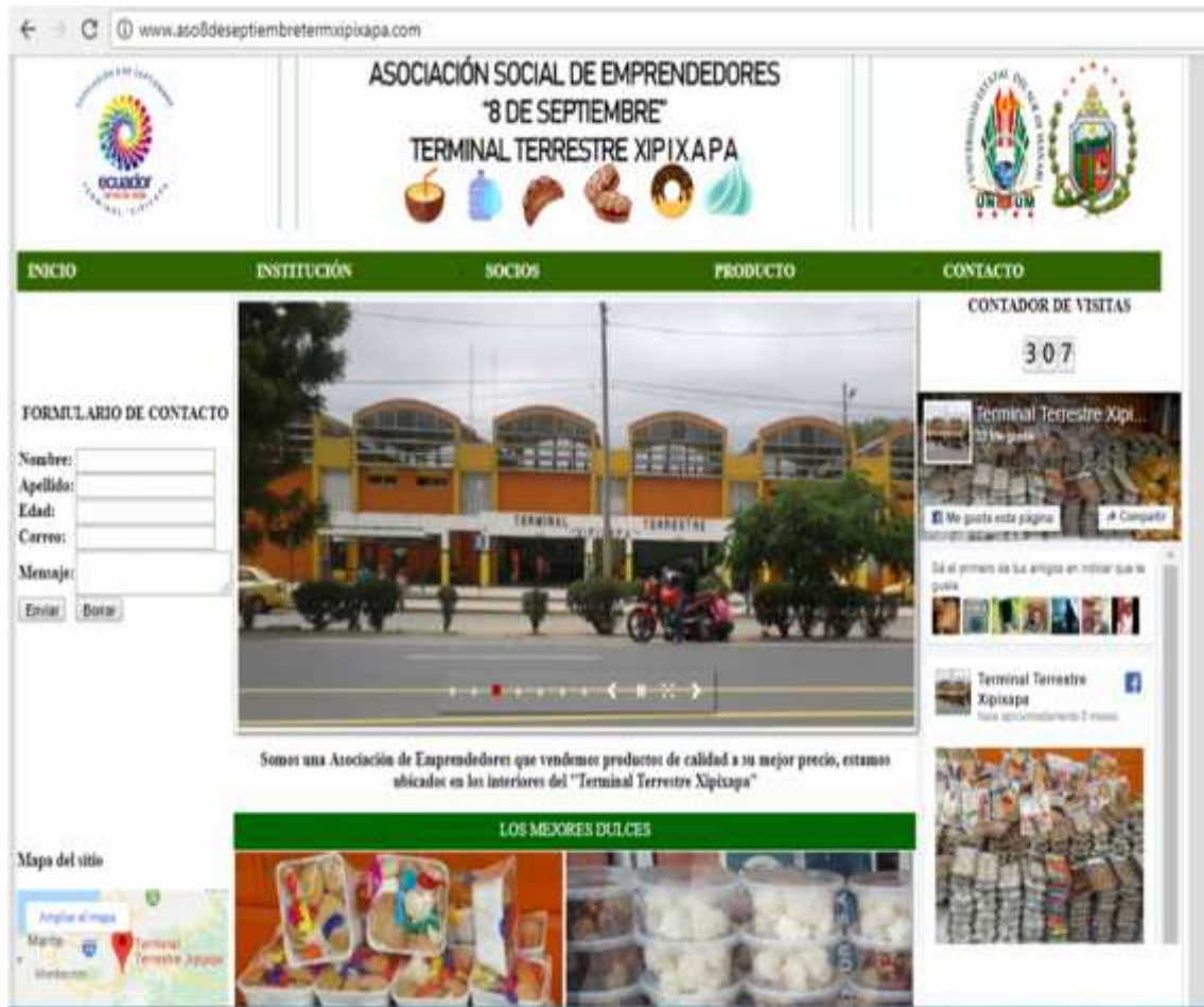
Figura 1. Modelo de página Web.