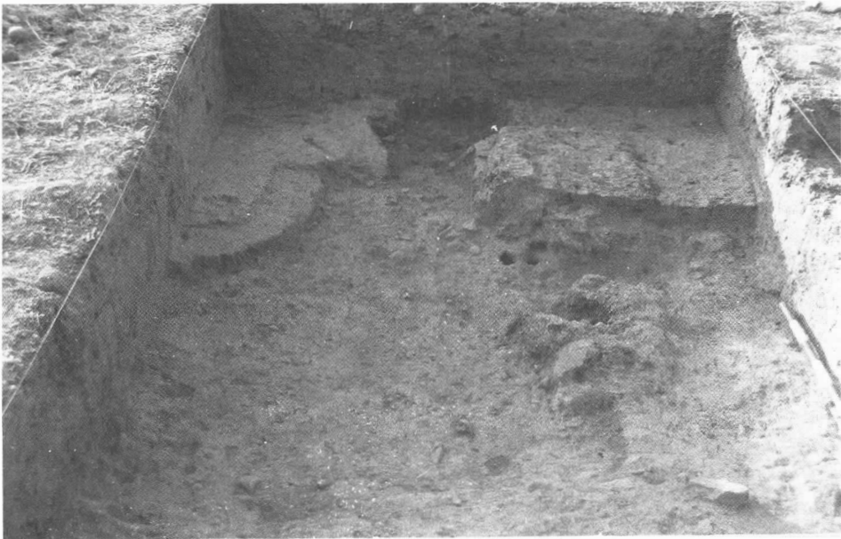
Lám. 2. Vista general de los Hogares I y II.