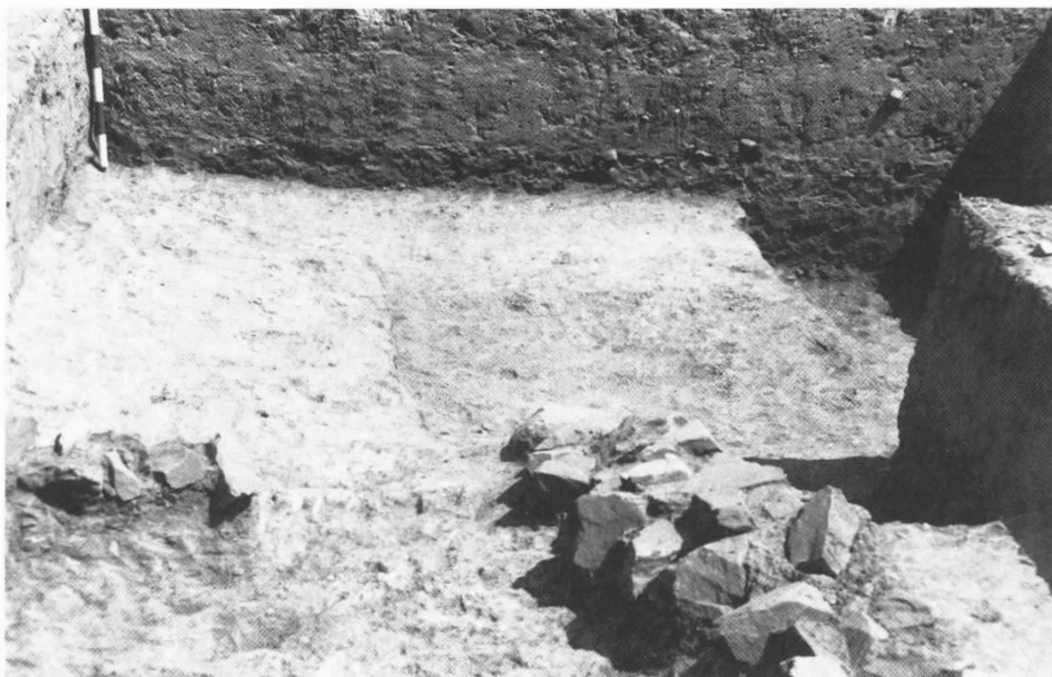
Lám. 3. Detalle de los muros II y III.