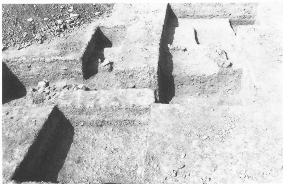
Lám. 4. Vista general fin de excavación.