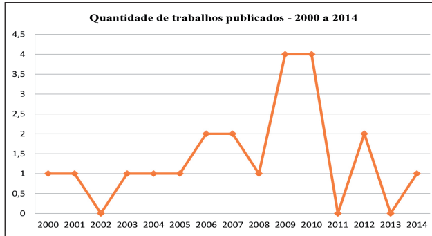
Gráfico 1 - Quantidade de trabalhos publicados que abordam estudos sobre o professor formador dos cursos de Licenciatura em Matemática.

dade no ano seguinte. Dos 21 trabalhos em análise, identifica-se 11 teses e 10 dissertações.