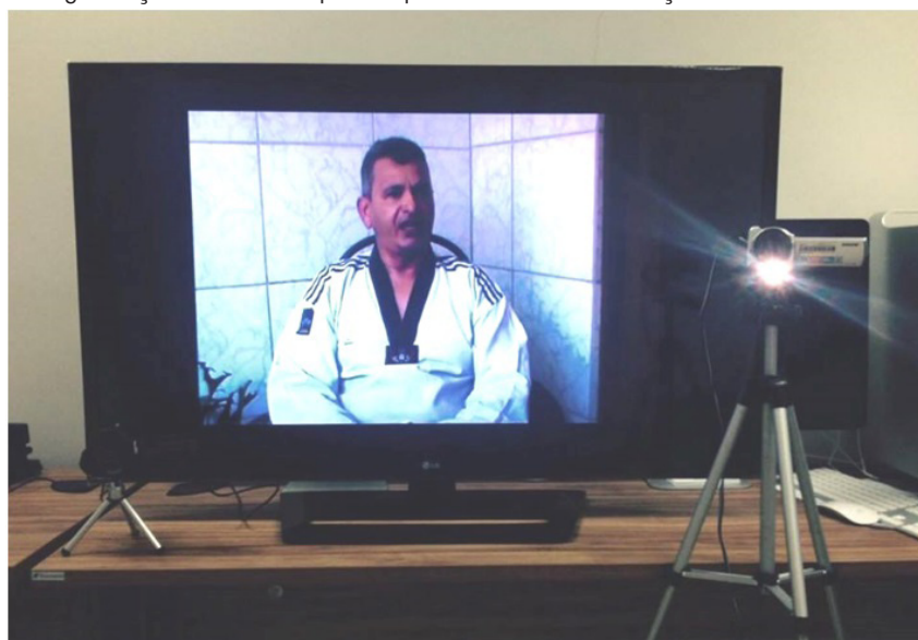
Imagem 3 – Organização do material para captura da autoconfrontação