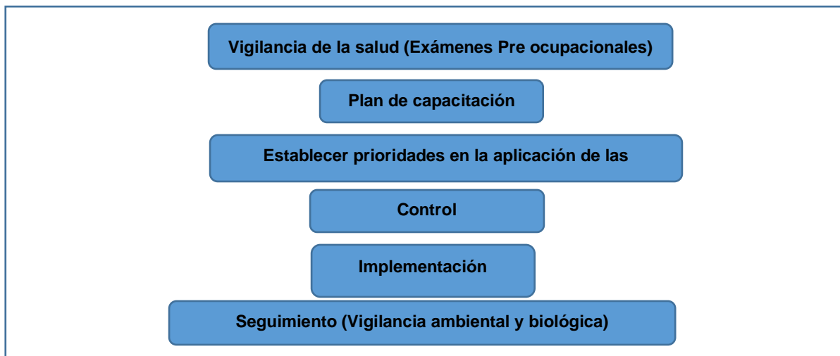
Figura 2. Procedimiento para la aplicación del plan de acción.