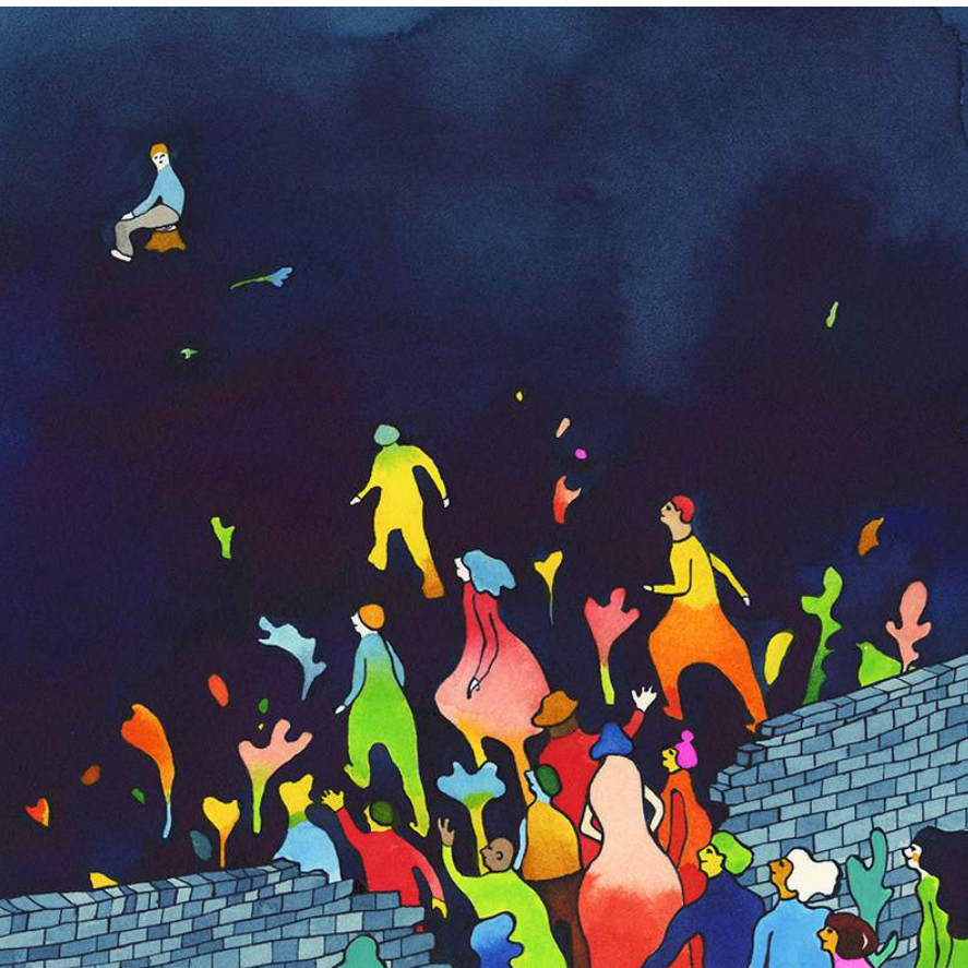
▪ Salud mental/La crisis que la autocuarentena nunca curará, ilustración, 2020 Autora: Nomoco.

En los primeros cinco meses del año fiscal 2019, 6.289 cubanos acudieron a los puertos de entrada en la frontera entre los Estados Unidos y México sin documentos. La cifra se encamina a casi duplicar el total para todo el año fiscal 2018, según datos de Aduanas y Protección Fronteriza