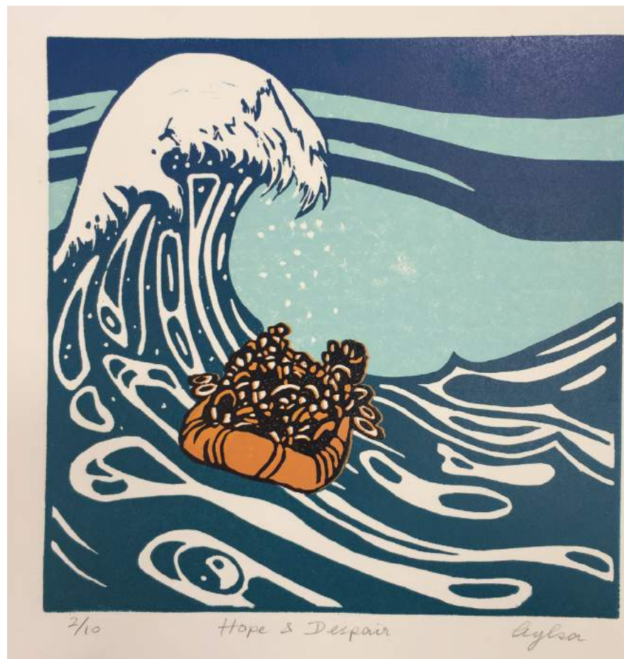
■ Esperanza y desesperación , linograbado | Autora: Aylsa Williams. Tomado de: South Hampton City Gallery

Para el cierre del primer trimestre del 2019, los ciudadanos cubanos eran el grupo que se registró con mayor número de entradas a México. Según datos de la Segob, los migrantes de nacionalidad cubana ocupan el tercer lugar como solicitantes de la condición de refugiados en México al cierre de agosto del 2019. De acuerdo con los cortes establecidos y en términos generales, siguen siendo bajos los porcentajes de reconocidos como refugiados en México