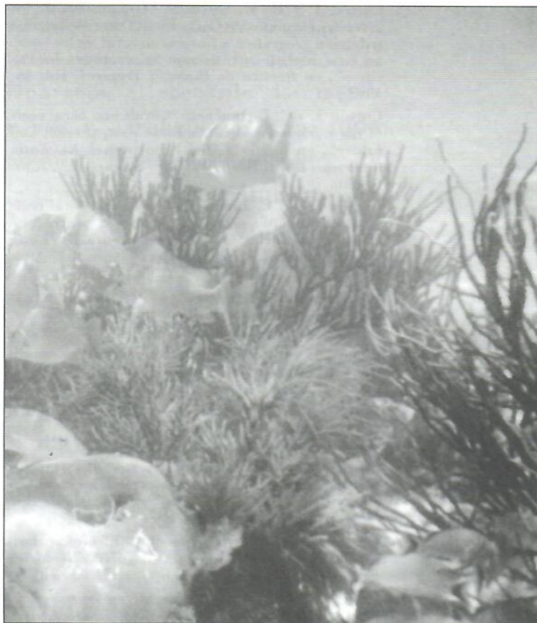
Francisco Pizaro (UICN)

Los arrecifes coralinos han perdido mucho de su coral vivo por el calentamiento de las aguas ocasionado por el fenómeno El Niño (Cortés et al. 1984): en 1982-1983 causó mortalidad de hasta el 50% en la Isla del Caño (Guzmán et al. 1987), y en 1997-1998 de aproximadamente el 5% en ese mismo lugar (Guzmán y Cortés en prensa) y también en Bahía Culebra (Jiménez et al. en prensa). Otras causas de muerte de corales son la marea roja, que los asfixia; la de 1985 los afectó mucho (Guzmán et al. 1990), y la exposición al aire por levantamiento de la costa, como sucedió por el terremoto de Limón. Pero los principales impactos degradadores de los arrecifes y comunidades coralinas de Costa Rica son antropogénicos, asociados con la sobreexplotación de recursos y la actividad turística. El peor es el derivado de la sedimentación producida por la deforestación, las malas prácticas agrícolas y la alteración de la zona costera (Cortés y Risk 1985, Cortés 1990).