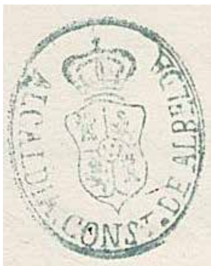
Sello constitucional de Albelda.

y, pocos meses después, culmina el proceso de adopción del escudo municipal, que se aparece publicado de manera definitiva en el Boletín Oficial de La Rioja el 21 de abril de 1984, mediante el Decreto 13/1984, de 5 de abril, por el que se autoriza al Ayuntamiento de Albelda de Iregua (La Rioja) para adoptar su Escudo Heráldico Municipal.