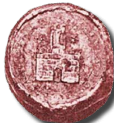
Sello medieval del año 1305