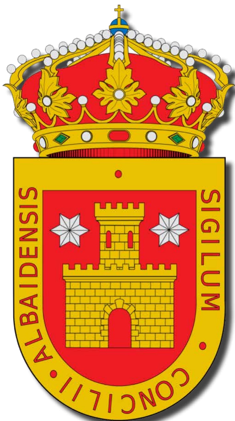
Escudo actual de Albelda de Iregua