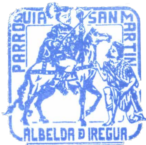
Sello de la parroquia de San Martín

La historia del escudo de Albelda se remonta a tiempos medievales, en relación con el monasterio de San Martín.