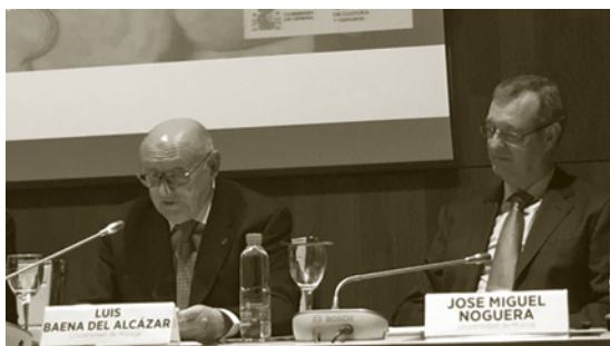
Figura 1. Instante en el que toma la palabra el homenajeado. Sala de conferencias del Museo Arqueológico Nacional