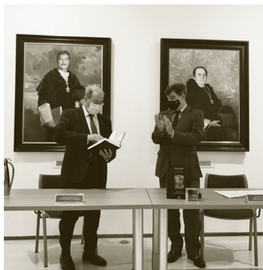
Figura 4. Instante de la entrega del libro. Sala de Rectores del Rectorado de la Universidad de Málaga

ilustrativos prefacios. La pars prima pone la mirada en la complejidad y heterogeneidad de los campos de estudio de Pedro Rodríguez Oliva. En cambio, la compilación de trabajos con novedosos resultados para la crítica nacional e internacional, es el objeto de la pars secunda . Como colofón, cierra el libro una extensa tabula