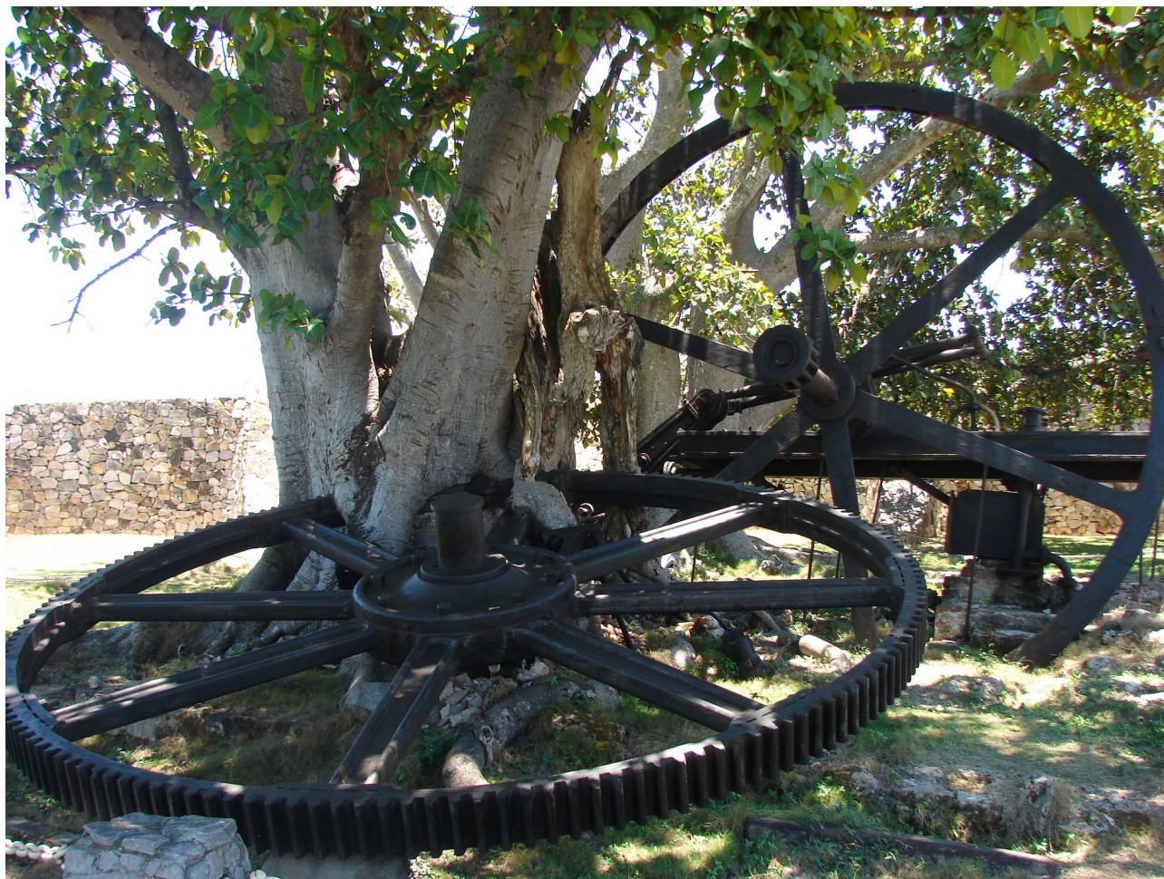
Fig. 6. Restos arqueológicos del Ingenio Demajagua. 2013. Granma. Cuba.

renunciaron a sus costumbres, tradiciones, lenguas y creencias. Por el contrario, encontraron en la mina, el cafetal, el ingenio, incluso en el templo religioso católico, la forma de reinterpretar símbolos, códigos y bondades de la naturaleza para enriquecer su cosmovisión y luchar por su libertad.