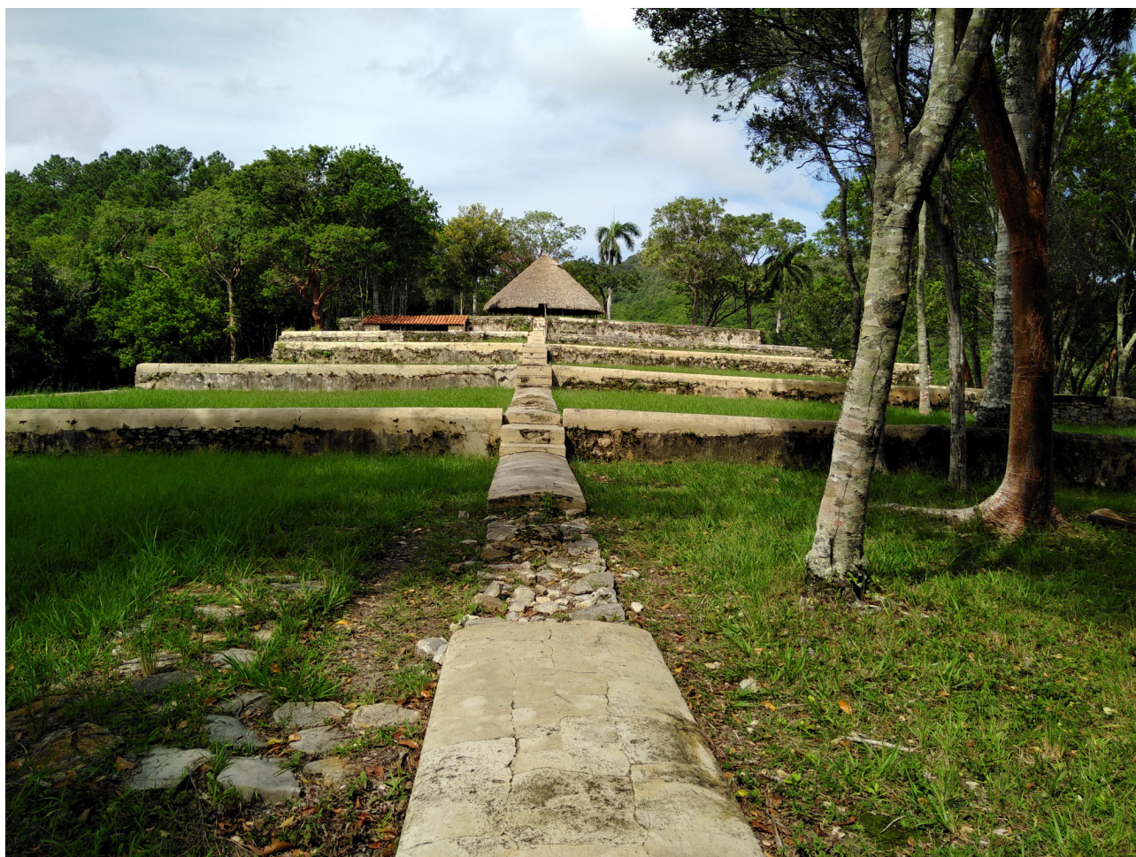
Fig. 4. Restos arqueológicos de los cafetales de la Sierra del Rosario. 2018. Artemisa. Cuba.

mente. La producción a gran escala fue posible gracias a la llegada de métodos de cultivo, de aprovechamiento del agua, de ingeniería para la construcción de caminos, acueductos y vías férreas, así como la aplicación de los avances de la Revolución Industrial, cuyo principal aporte al proceso fue la adaptación de la máquina de vapor como fuente de locomoción del ferrocarril 11 y el surgimiento del ingenio 12 . Inglaterra, Estados Unidos y Francia tuvieron un rol protagónico en el intercambio de valores generados.