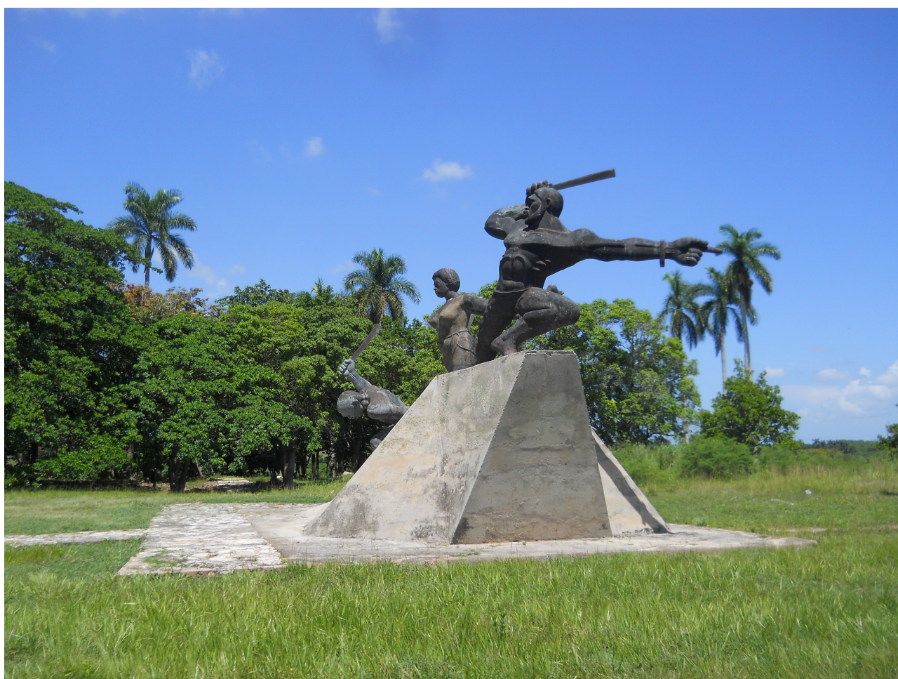
Fig. 7. Monumento al Esclavo Rebelde, ruinas del Ingenio Triunvirato. 2017. Matanzas. Cuba.

Los ingenios Triunvirato, Demajagua y Alejandría constituyen el núcleo industrial, administrativo y sociocultural de extintas plantaciones. Sin embargo, no incluyen dentro de sus límites áreas de cultivo, que constituyen la esencia del