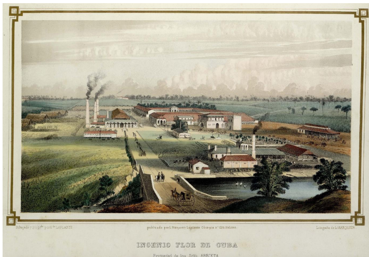
Fig. 1. Eduardo Laplante. Libro de los ingenios: Ingenio Flor de Cuba. Grabado. Museo Nacional de Bellas Artes, La Habana, Cuba.

declarados Monumento Nacional 6 ; 16 en total 7 , descartando aquellos que hoy no tienen tal condición 8 .