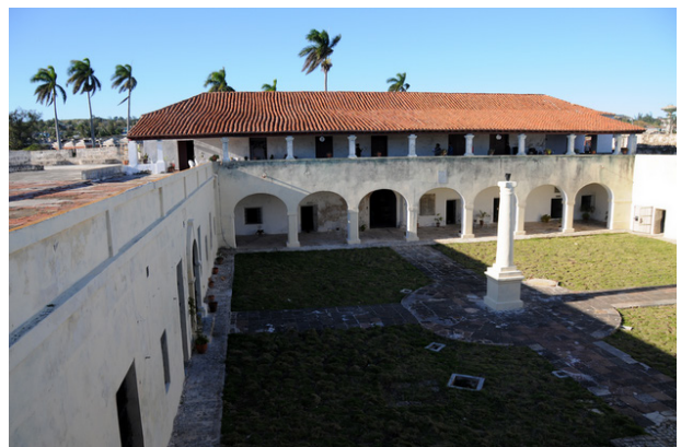
Fig. 3. Castillo de San Severino. 2013. Matanzas. Cuba.

El proceso de formación de paisajes culturales vinculados a la producción de azúcar y café fue el resultado del trabajo esclavo y la introducción de técnicas y conocimientos que comienza con la entrada de estas especies oriundas del sudeste asiático y norte de África respectiva-