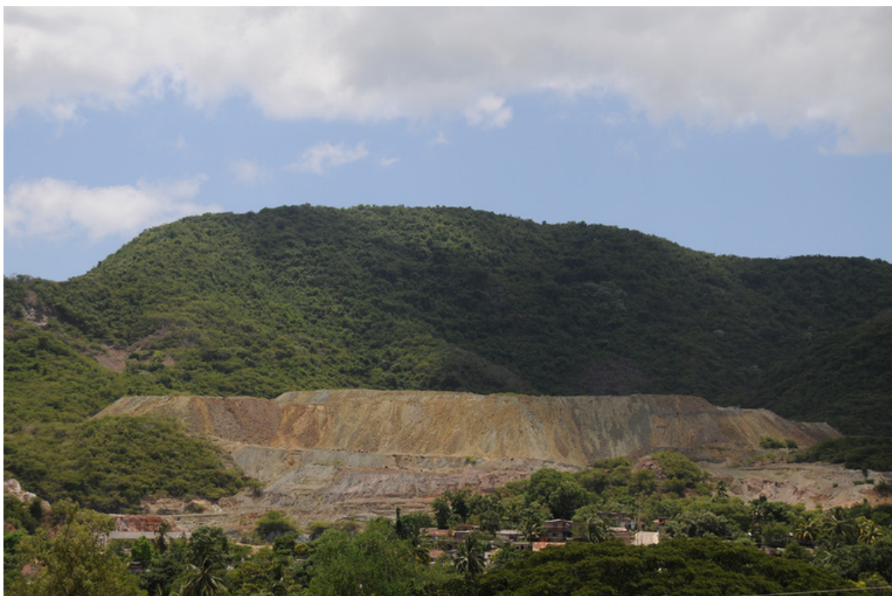
Fig. 5. Paisaje Cultural del Cobre. 2013. Santiago de Cuba. Cuba.

Además de testimoniar aspectos excepcionales de la sociedad esclavista, la serie en cada uno de sus componentes es portadora de una tradición generada en el propio proceso social y económico, la resistencia cultural de la masa de mujeres y hombres sometidos, pero que nunca